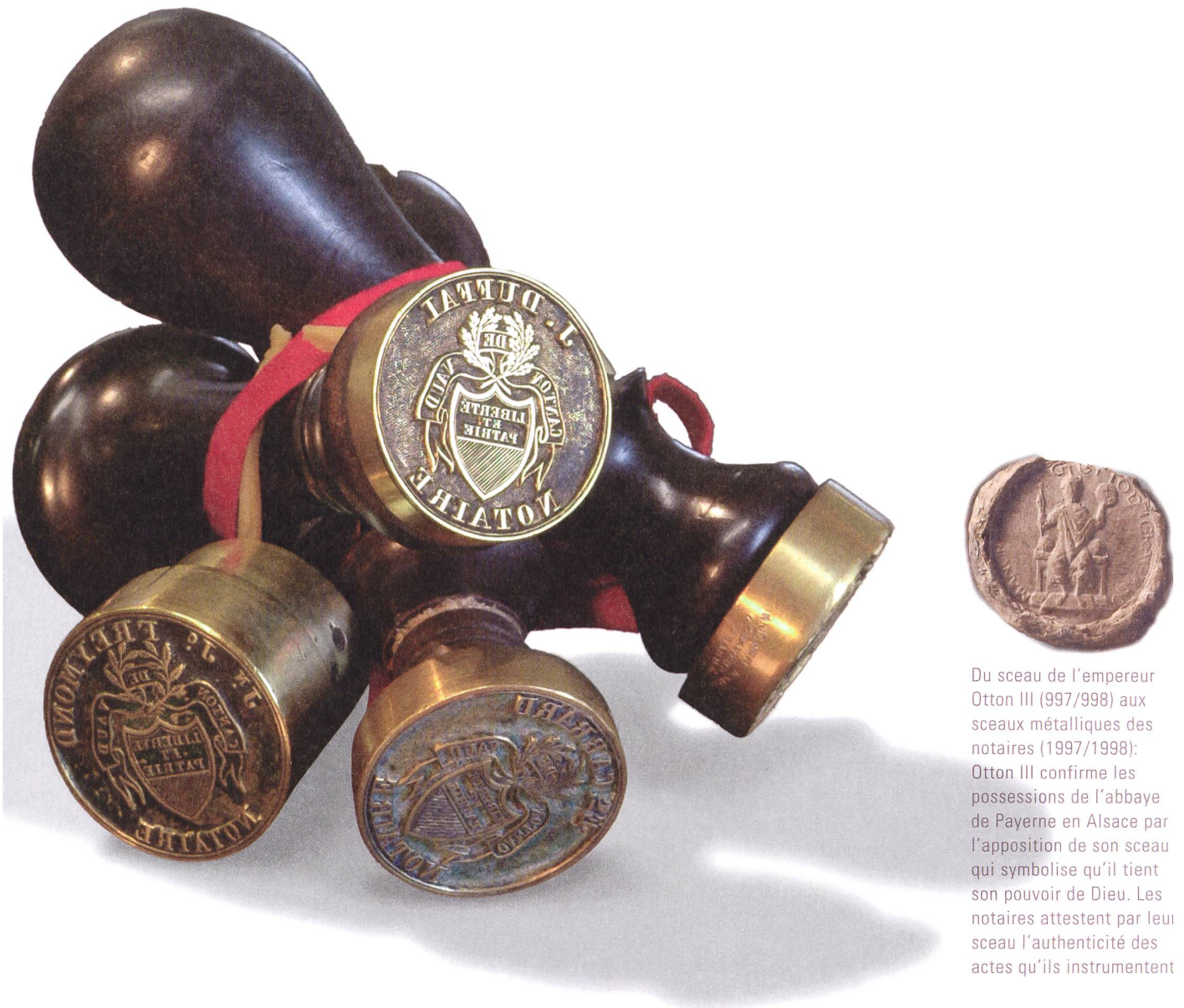
Du sceau de l'empereur Otton III (997/998) aux sceaux métalliques des notaires (1997/1998): Otton III confirme les possessions de l'abbaye de Payerne en Alsace par l'apposition de son sceau qui symbolise qu'il tient son pouvoir de Dieu. Les notaires attestent par leur sceau l'authenticité des actes qu'ils instrumentent