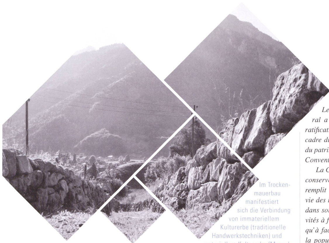
Im Trockenmauerbau manifestiert sich die Verbindung von immateriellem Kulturerbe (traditionelle Handwerkstechniken) und materiellem Kulturerbe (Mauer).