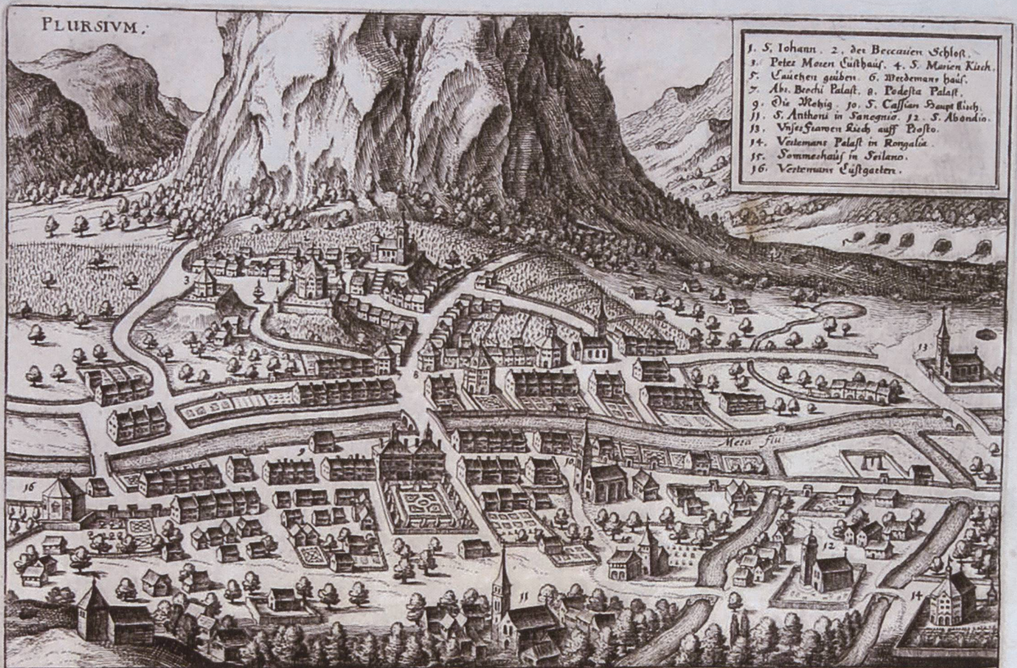
Eigentlich Vorbildung des schönen Fleckens Plies, vnd wie derselbe nach seinem schrecklichen vndergang beschaffen. 1658.