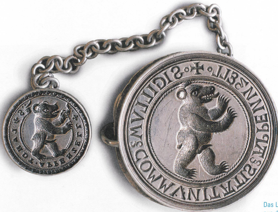
Das Landessigill aus dem Jahr 1518.