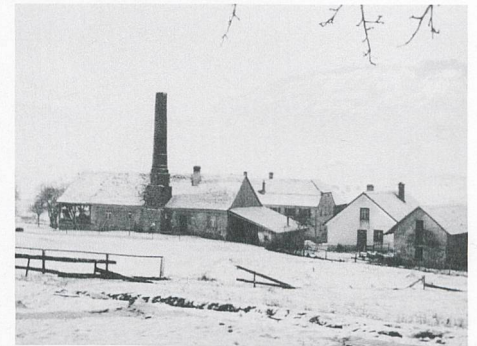
Blick auf die Ziegelei in Nendeln. Foto aus dem frühen 20. Jahrhundert.

Reinhold Meier. Geniale Erfindung illustriert Epochenwechsel. In Nendeln liegt ein Hoffmannscher Ringofen verborgen. In: Terra Plana. Zeitschrift für Kultur, Geschichte, Tourismus und Wirtschaft. Ausgabe 2013, Nr. 4, S. 30–33.