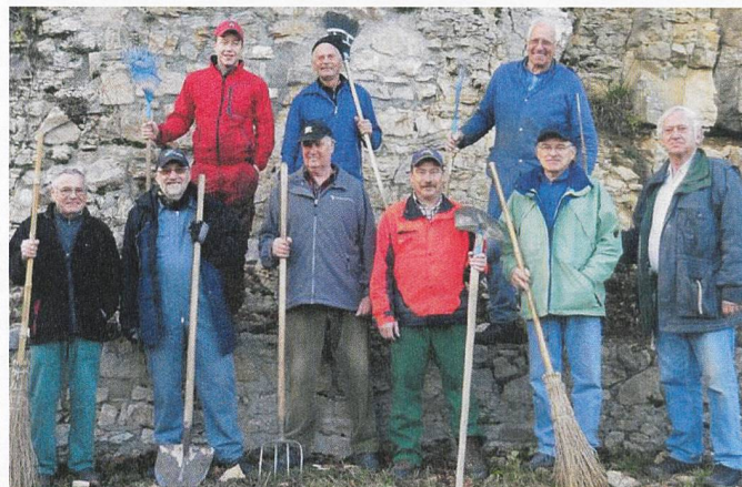
Abb. 7: Freiwillige Ruinenpfleger auf der Ruine Tierstein, Gipf-Oberfrick.

Im Sinne einer Zwischenbilanz nach drei Jahren Entwicklung und Umsetzung des Konzepts «Archäologie vor Ort und am Objekt» lässt sich konstatieren, dass die öffentliche Präsenz der Fachstelle und die Wahrnehmung archäologischer Themen im Kanton Aargau markant erhöht und qualitativ verbessert werden konnte, was sich in den Nutzerzahlen der Website, in der Anzahl und Qualität der Medienberichterstattung, in den Teilnehmerzahlen der Angebote und in vielen positiven persönlichen Rückmeldungen widerspiegelt. Das Entwicklungspotenzial ist weiterhin gross.