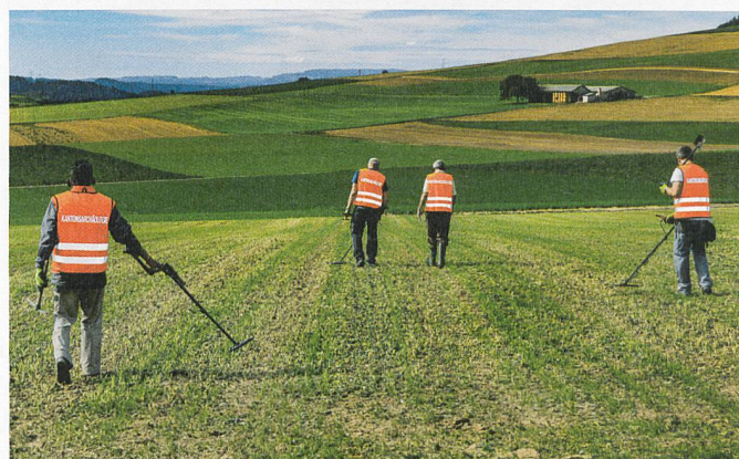
Abb. 8: Weiterbildungstag der freiwilligen Prospektorengruppe in Schneisingen: Gemeinsam wird eine kaum bekannte, neuzeitliche Fundstelle prospektiert, mit dem Ziel, diese am einige Wochen später stattfindenden Kulturerbetag zu thematisieren.

Diese Erfahrungen zeigen, dass es möglich ist, die Verankerung der Archäologie in der Gesellschaft im Sinne der Konvention von Faro zu verbessern. Voraussetzungen dafür sind aber