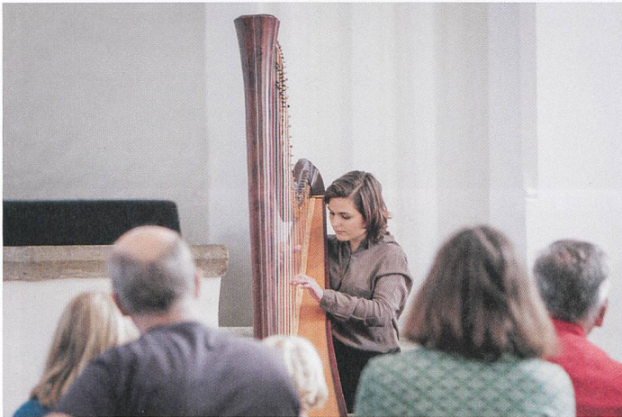
Abb. 4: Musik als Kulturerbe im Künstlerhaus Boswil (Kulturerbetag Boswil 2018).