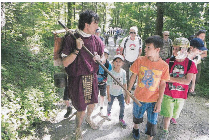
Abb. 6: Aargauer Zeitung-Leserwandern 2018, 1. Etappe: Auf den Spuren der Römer über den Bözberg. Landschaftsführung in Begleitung römischer Legionäre vom Legionärspfad des Museums Aargau.

Fachstelle als ressourcenbindende Störfaktoren empfunden. Allgemein gibt es heute viele Interessierte, die sich gerne aktiv für ihr Kulturerbe engagieren würden. Meistens jedoch sehen sie sich von der Fachwelt in eine passive Rolle als Besucher, Konsument oder Beobachter gedrängt. Vor diesem Hintergrund und gestützt auf das kantonale Kulturkonzept lancierte die Kantonsarchäologie 2017 gemeinsam mit anderen Sektionen der Abteilung Kultur (Kunsthhaus, Bibliothek und Archiv Aargau) ein Freiwilligenprogramm, das die Teilhabe freiwillig engagierter, kulturbegeisterter Menschen im Aargau fördern soll. Ziel der Kantonsarchäologie ist es, schrittweise eine für alle Beteiligten stimmige, nutzbringende und nachhaltige Zusammenarbeit mit Aargauer Archäologie-Freiwilligen aufzubauen. In der laufenden ersten Programmphase wird eine Prospektorengruppe gebildet und entsprechend geschult (Abb. 8). Die Mitglieder übernehmen in Absprache mit der Kantonsarchäologie Feldbegehungen, Metalldetektorprospektionen und Baugrubenkontrollen. Weitere Angebote für Archäologie-Freiwillige kommen ab 2019 hinzu.