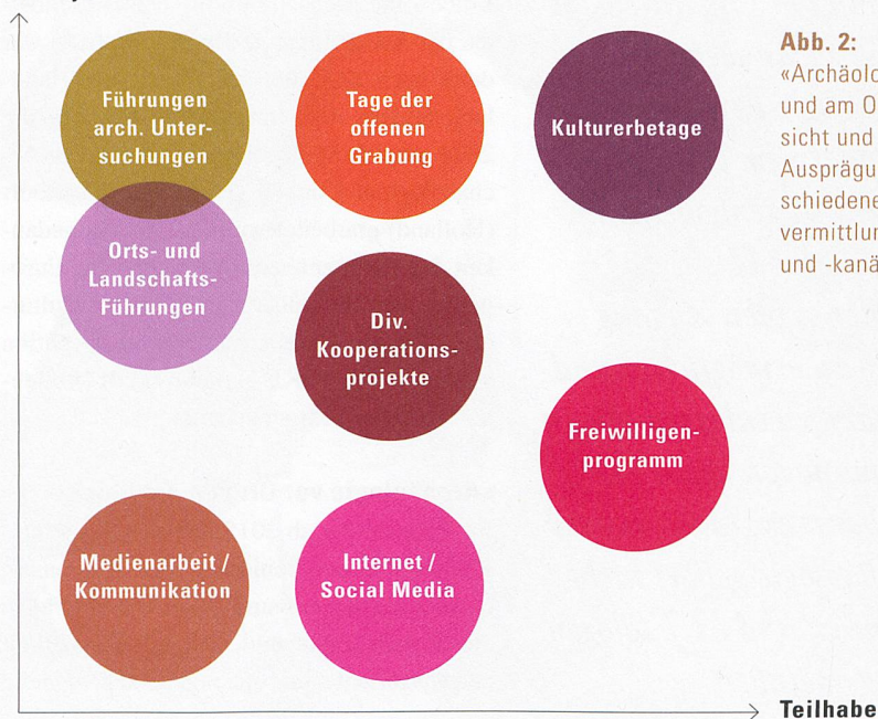
Abb. 2: «Archäologie vor Ort und am Objekt»: Übersicht und inhaltliche Ausprägung der verschiedenen Publikumsvermittlungsformate und -kanäle.