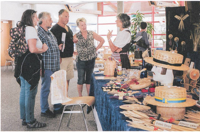
Abb. 3: Strohflechten live erklärt – und zum selber ausprobieren (Kulturerbetag Boswil 2018).