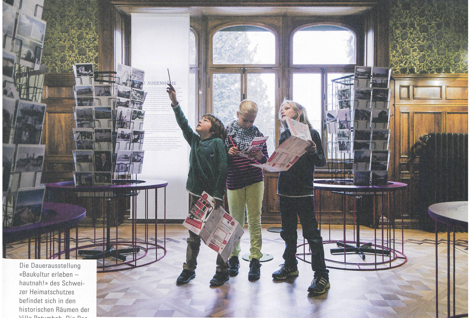
Die Dauerausstellung «Baukultur erleben – hautnah!» des Schweizer Heimatschutzes befindet sich in den historischen Räumen der Villa Patumbah. Die Restaurierung des Anwesens erfolgte von 2010 bis 2013 und begleitet an unterschiedlichen Stellen thematisch das Vermittlungsangebot im Heimatschutzzentrum.