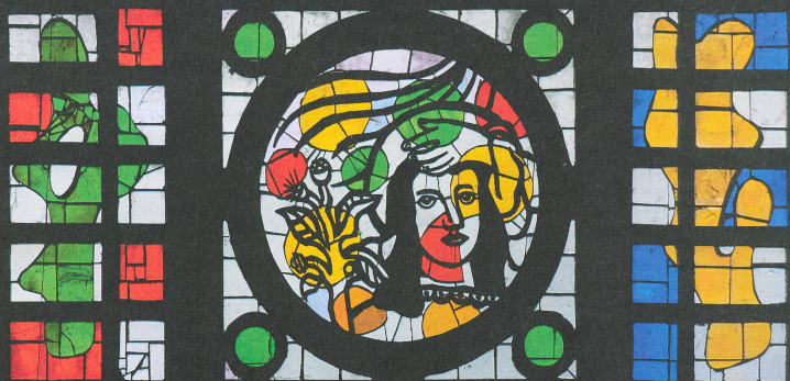
Fig. 1: Fernand Léger, L'Annonciation, église Saint-Germain d'Arvorre, Courfaivre, 1954