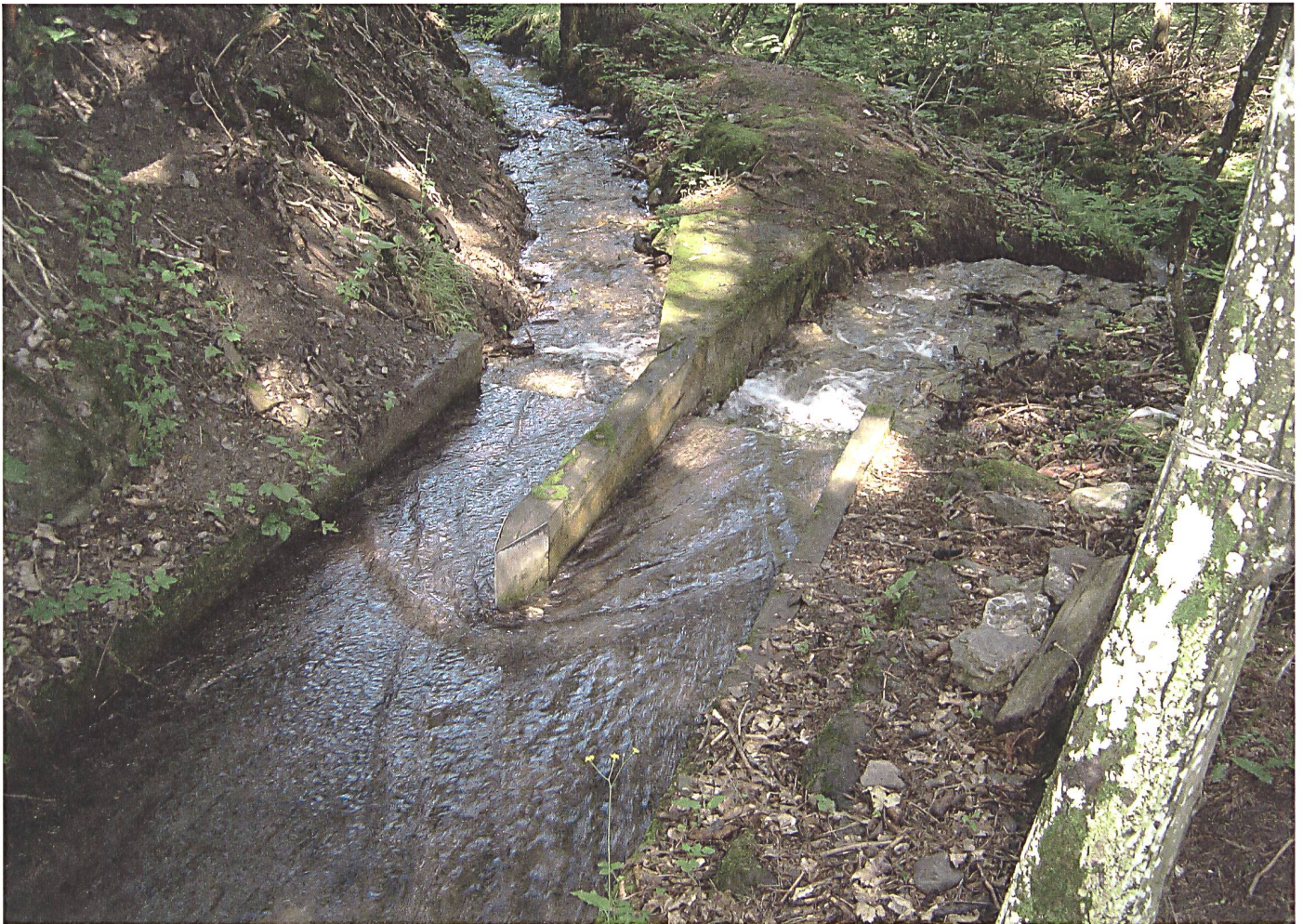
Répartiteur sur le Bitaille ▲

technique (pierre et bois) et surtout, le fait qu'ils n'aient pas disparu avec la modernité mais que les canaux se soient adaptés à différentes fonctions modernes.