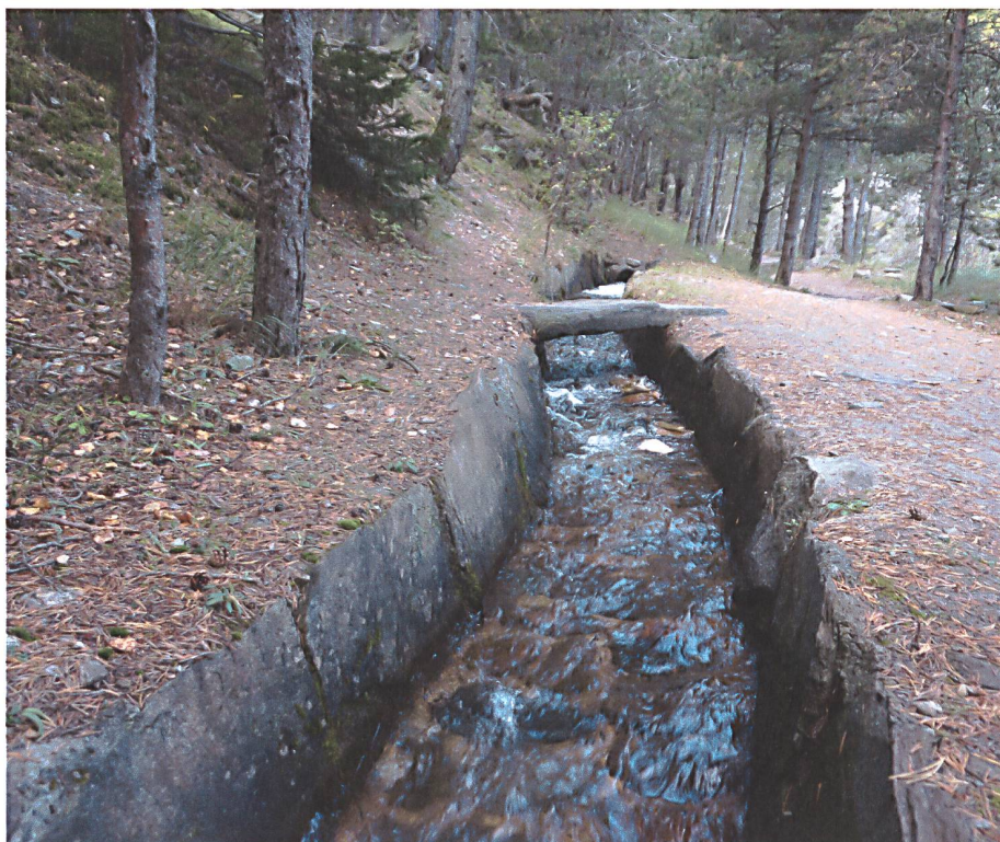
Bisse Untere Brigeri ▼

Il existe également d'autres utilisations «économiques» de l'eau des bisses: les énergies hydro-électriques parfois imbriquées dans le parcours des bisses de manière financière (bisse d'Ayent) ou encore, les rénovations de moulins actionnés par les bisses (Ausserberg et Nax). Il est vrai que la production d'électricité et les barrages en général peuvent être positif ou négatif sur le circuit des bisses et sur la faune et la flore de la région. Le canton du Valais s'est doté d'un «plan eau» pour le futur qui étudie la possibilité de faire des grosses structures de captation d'eau comme des barrages pour capter l'eau de l'hiver en altitude et la redistribuer pour un multi-usage (électricité, irrigation et eau potable) et d'un autre côté, une multitude de petites structures (petite turbine, étangs, marais) qui sont plus compliquées à gérer mais ont moins d'impact. Il s'agit d'une question complexe avec des enjeux au niveau environnement, sécurité en eau, financiers et autonomie.