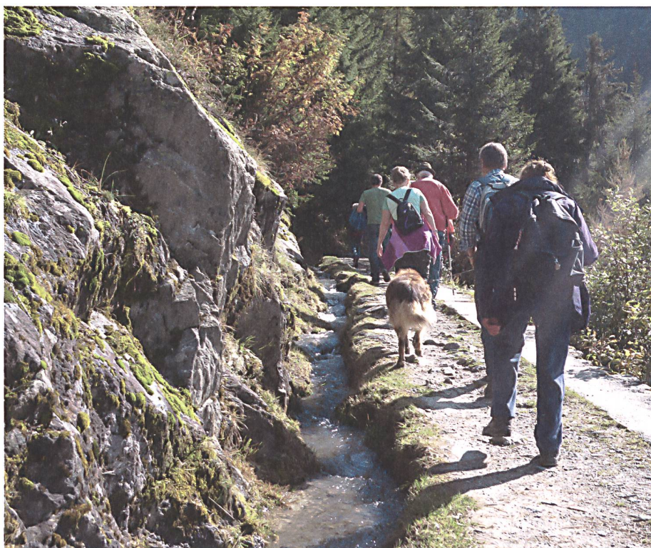
Bisse du Trient ▲