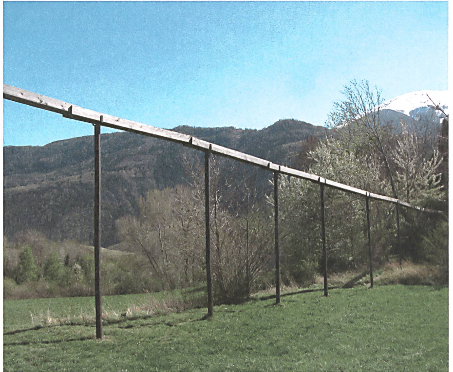
▲ Bisse Niwä-Bietsch ▼ Bisse de Lentine

«En Valais, sans bisses, les prairies seraient restées jaunes, sans prairies, les vaches seraient restées maigres, sans vaches, nous n'aurions pas de fromage, sans fromage, nous n'aurions pas la raclette et sans la raclette, serions-nous toujours Valaisans?» Le bisse est un emblème de la «culture montagnarde de la vache», car il est fortement lié aux populations alpines et aux prairies d'élevage de bovins. Il est, au même titre que les bâtiments et les églises protégés, un témoin central de l'histoire rurale des Alpes, révélateur d'un mode de fonctionnement social propre à ces milieux. Effectivement, les canaux d'irrigation d'altitude sont communs aux populations de montagne, donc ils sont visibles au Grisons, au Tessin, au Tyrol, au Val d'Aoste, et même au Népal et au Pérou. Par contre, le mot «bisse» est utilisé uniquement en Valais et les spécificités de notre région résident dans la quantité d'infrastructure (300 à 400 bisses), leur qualité