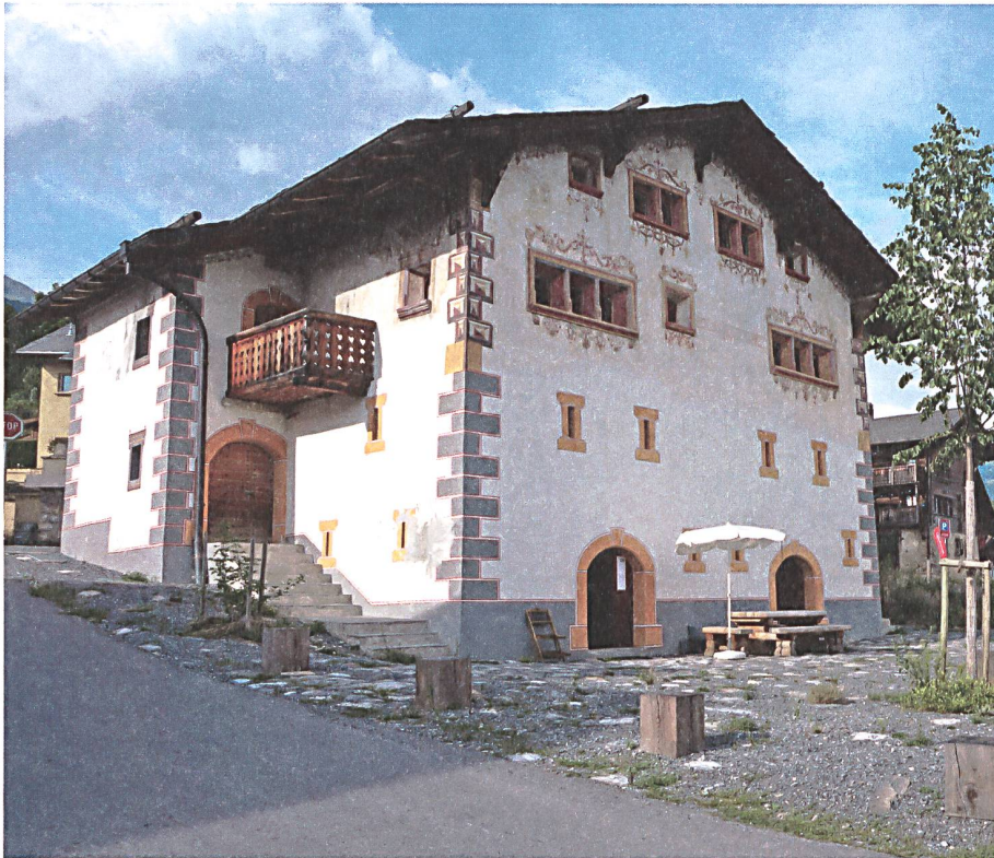
Le Musée valaisan des Bisses à Botyre/Ayent.

tifiques et des publications, ou encore, avec la création du Musée valaisan des Bisses en 2012. Actuellement, beaucoup de moyens humains et financiers sont accordés pour remettre en valeur ces structures.