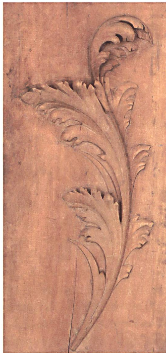
Abb. 5: Akanthusblatt geschnitzt.

Diese Beispiele stehen exemplarisch für die Bedeutung, die die Bestände der Samm-