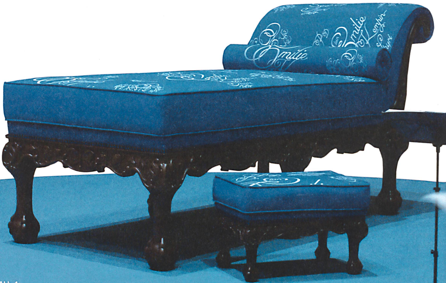
Abb. 1: Pipilotti Rist, Chaiselongue – Denkmal für Emilie Kempin-Spyri im Lichthof der Universität Zürich, 2008.