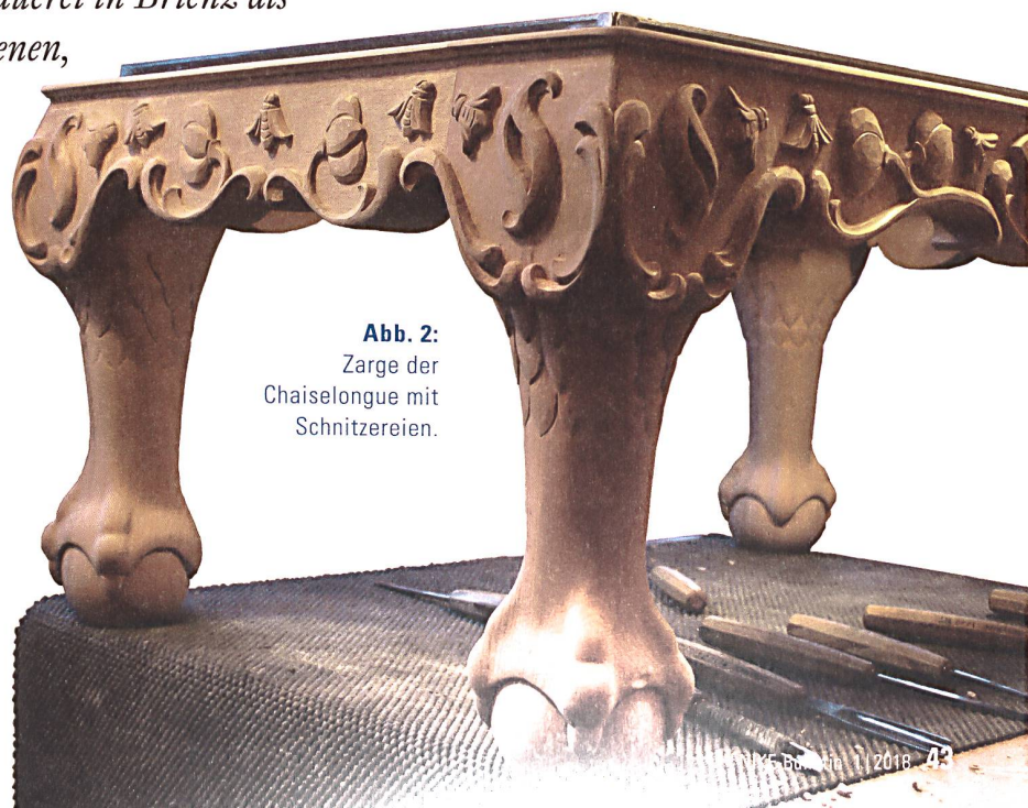
Abb. 2: Zarge der Chaiselongue mit Schnitzereien.