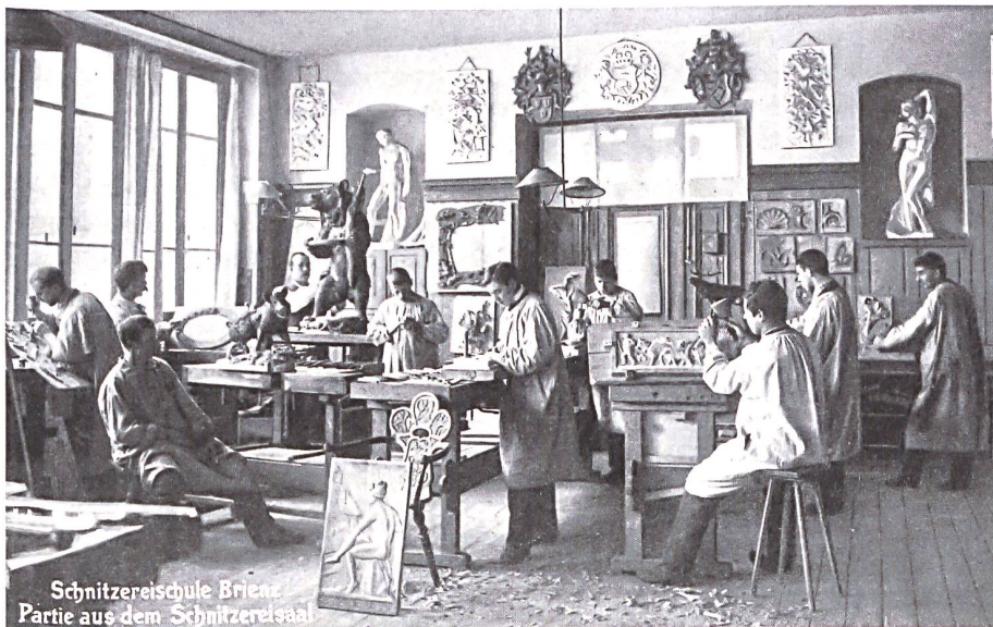
Schnitzerschule Brienz Partie aus dem Schnitzersaal

lung und das Kopieren nach Vorlagen in Brienz bis zum heutigen Tag in der Ausbildung zum Holzbildhauer und zur Holzbildhauerin spielen (Abb. 6). Zur Zeit der Gründung der Schule in der Epoche des Historismus noch unverzichtbare Grundlage jeder kunstgewerblichen Ausbildung, hatten historische Vorlagen mit den Reformbewegungen um 1900 hingegen an Bedeutung verloren. Auch das Kantonale Gewerbemuseum Bern unterzog den Bestand seiner «kunstgewerblichen Sammlung» 8 einer Revision, veräusserte Objekte oder übergab sie der Schnitzerschule Brienz, die weiterhin für eine traditionelle Ausbildung eintrat. 2016 überführte dann die Berner Design Stiftung den Rest der Objekte aus dem Bereich Holz in das eigens für die Sammlung am Standort der Schule errichtete Depot.