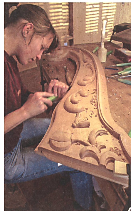
Abb. 6: Schülerin beim Bearbeiten der Schnitzereien der Seitenstützen der Rücklehne der Chaiselongue.

solcher Produkte oder der Tendenz zur Individualisierung und Privatisierung der Konsumenten in Verbindung gebracht sowie der Sehnsucht nach haptischer Qualität in einer mehr und mehr digitalisierten Welt zugeschrieben, und es werden Beziehungen zu Trends wie die «Do-it-yourself»-Bewegung analysiert. Mit diesen Beispielen sind nur einige Themen genannt, die die aktuellen Debatten übers Handwerk prägen. Die Fragestellungen sind vielfältig und abhängig von historischen und kulturellen Entwicklungen, allen gemeinsam scheint ein Bewusstsein für die Bedeutung des Handwerks als wichtiger Bestandteil unserer materiellen Kultur und das Bemühen um eine neue Definition von «Handwerk» für eine sich verändernde Gesellschaft.