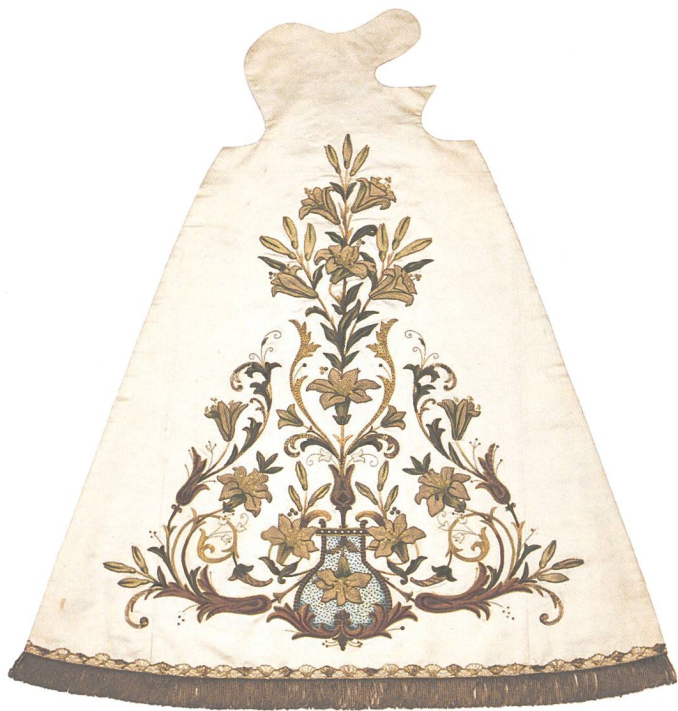
Abb. 3: Schwyzer-Kleid, weisse Seide, Chenille-Relief, Plüschapplikationen, 1922 vom Frauenkloster St. Josef Schwyz gestiftet.