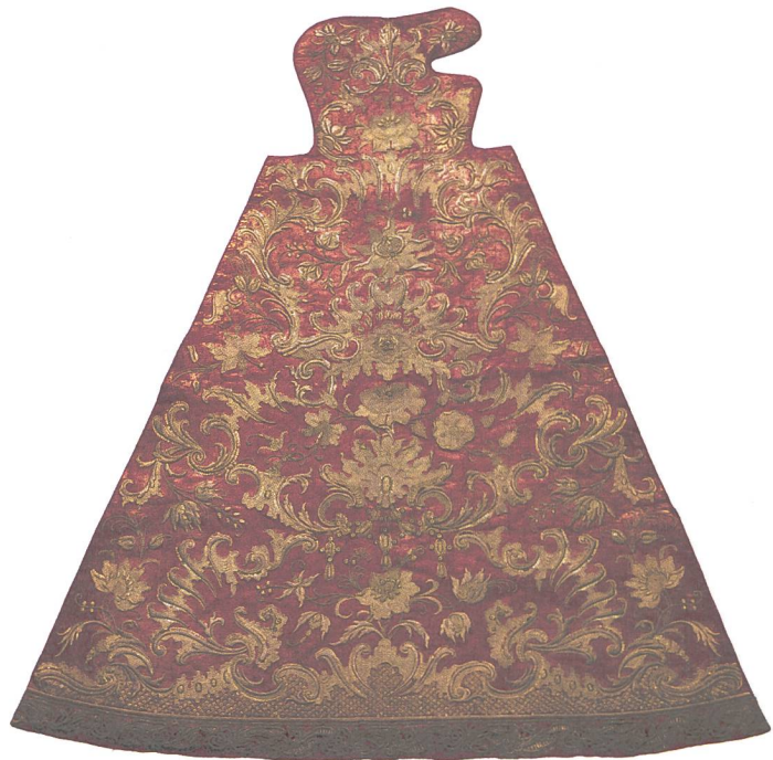
Abb. 4: Pfingstkleid, reiche Goldstickerei auf rotem Grund, gefertigt in Mailand 1750.