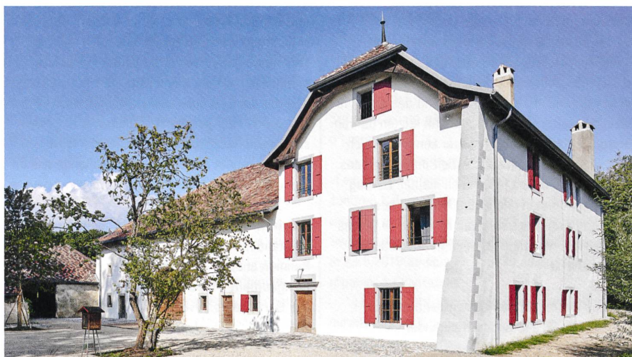
Le manoir du Bois des Chênes après sa restauration.