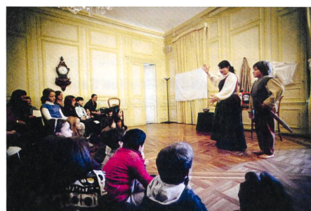
Un lieu d'une grande diversité d'activités: La Société de Lecture à Genève.