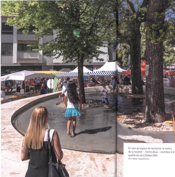
En tant qu'espace de rencontre, le centre de la localité – l'entre-deux – contribue à la qualité de vie à Riehen (BS).

Qu'implique la culture du bâti pour l'aménagement du territoire? Et qu'entend-on par «culture du bâti de qualité» dans cette discipline? À première vue, cette notion peut sembler l'apanage des spécialistes de la conservation du patrimoine. Mais à y regarder de plus près, elle est tout autant un élément essentiel du travail des aménageurs: il s'agit d'organiser et de développer l'espace sur le plan qualitatif. L'enjeu est la qualité des constructions, du paysage et de l'entre-deux.