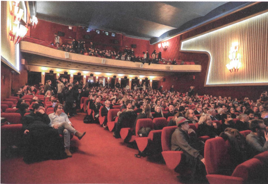
Première d'Ecrans Urbains 2018, Cinéma Capitole, Lausanne / Affiche Edition 2020 (18-23.12.2020)