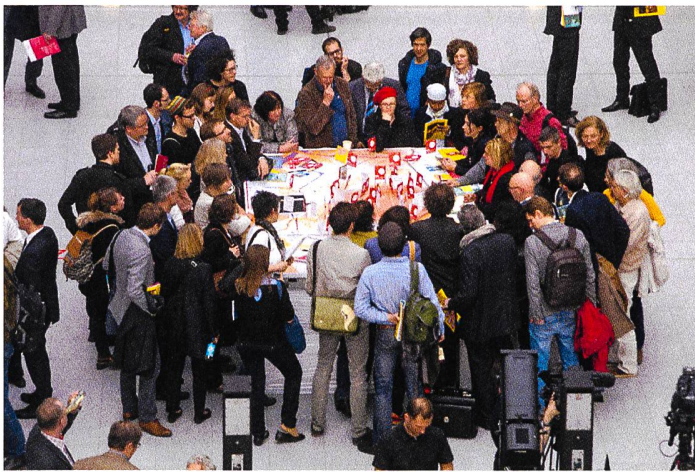
In Workshops werden Bedürfnisse erfragt, inhaltliche Grundlagen erarbeitet und Ergebnisse diskutiert.

Partizipation in der Denkmalpflege steht noch am Anfang. Nur empirisch lässt sich ausloten wie weitreichend Partizipation gedacht werden muss oder für welche Situationen sich welche Partizipationsform in der Denkmalpflege eignet.