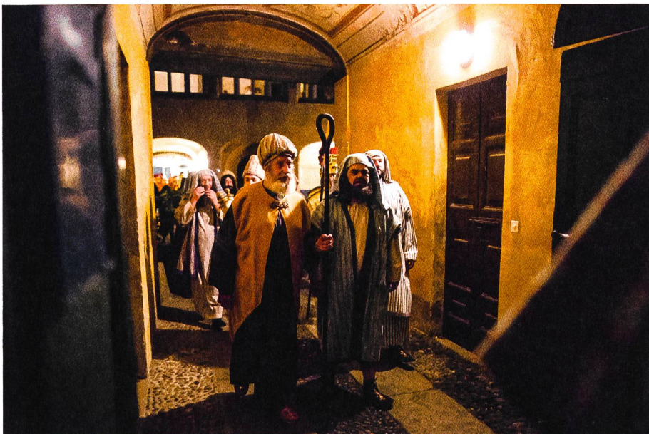
Il gruppo degli «ebrei» esce dal cortile dell'oratorio per inserirsi nella processione del Giovedì.