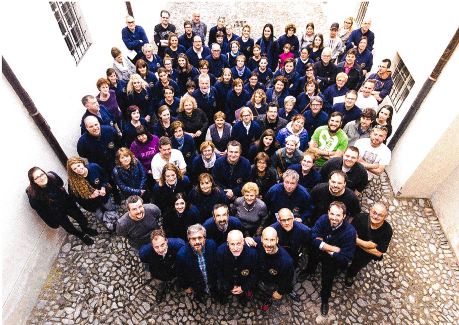
La squadra dei collaboratori del Venerdì santo del 2017 nel cortile dietro la chiesa di San Giovanni.

ria, in un clima straordinario di festa «seria», dalla quale non mancano risvolti umoristici, mai offensivi, per lo più autoironici.