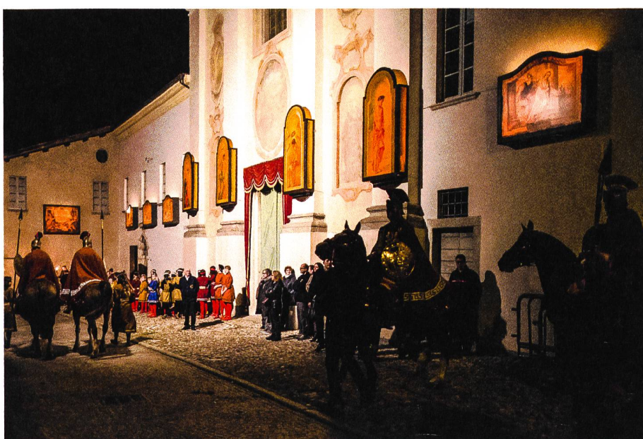
I soldati romani a cavallo aspettano che il gruppo con il Cristo esca dalla chiesa di San Giovanni con la facciata adorna dei «Trasparenti».