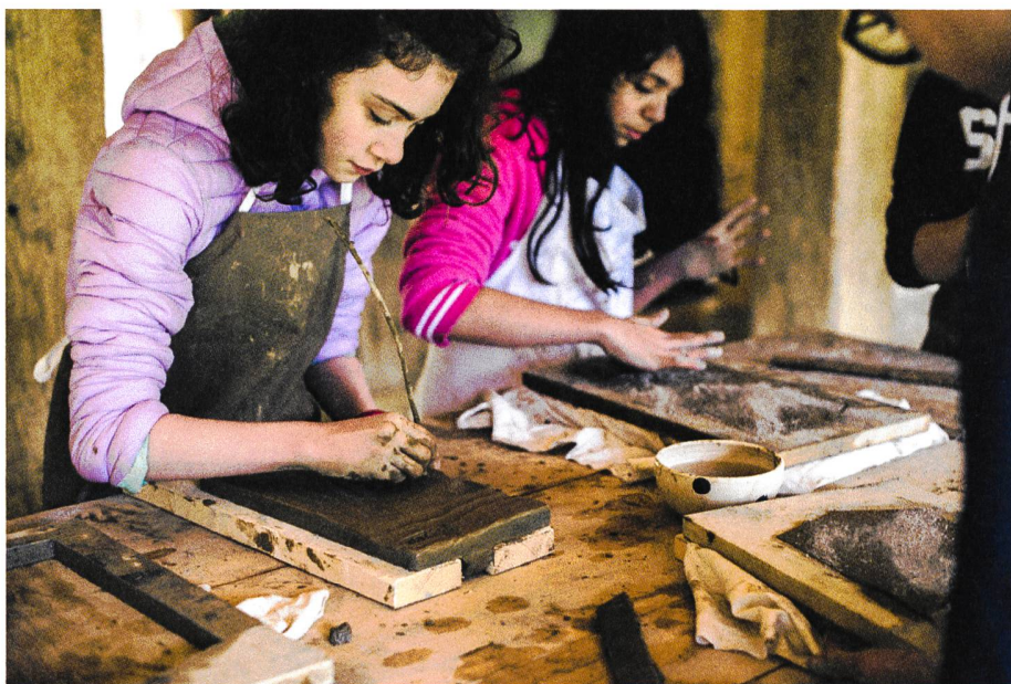
«Hausbesuch» 2018: Schülerinnen aus Péry formen Ziegel in der Ziegelei aus Péry BE auf dem Ballenberg.

ein, welche die Schaffung eines nationalen Freilichtmuseums prüfen sollte. Es gingen mehrere Vorschläge ein, derjenige aus Brienz (BE) vermochte zu überzeugen. 1968 wurde eine Stiftung gegründet. Bis zu seiner Verkleinerung im Jahr 2015 bestand der Stiftungsrat mit rund 70 Mitgliedern aus Vertretern aller Regionen der Schweiz. Für den Bau des Freilichtmuseums gaben Grundeigentümer ihr Land her und mehrere Fördervereine halfen mit, Gebäude zu suchen, die an ihrem jeweiligen Ort nicht erhalten werden konnten. Die Mitarbeit der Fördervereine ging sogar soweit, dass ein Speicher in einer Nacht und Nebel-Aktion vom Westschweizer Förderverein eigenhändig im Museum aufgestellt worden ist.