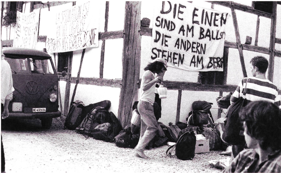
Hausbesetzung auf dem Ballenberg, 1987.