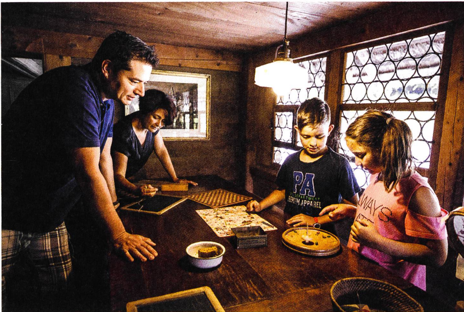
Das «Haus zum Berühren» wird zum Einrichtungshaus «IDEA».