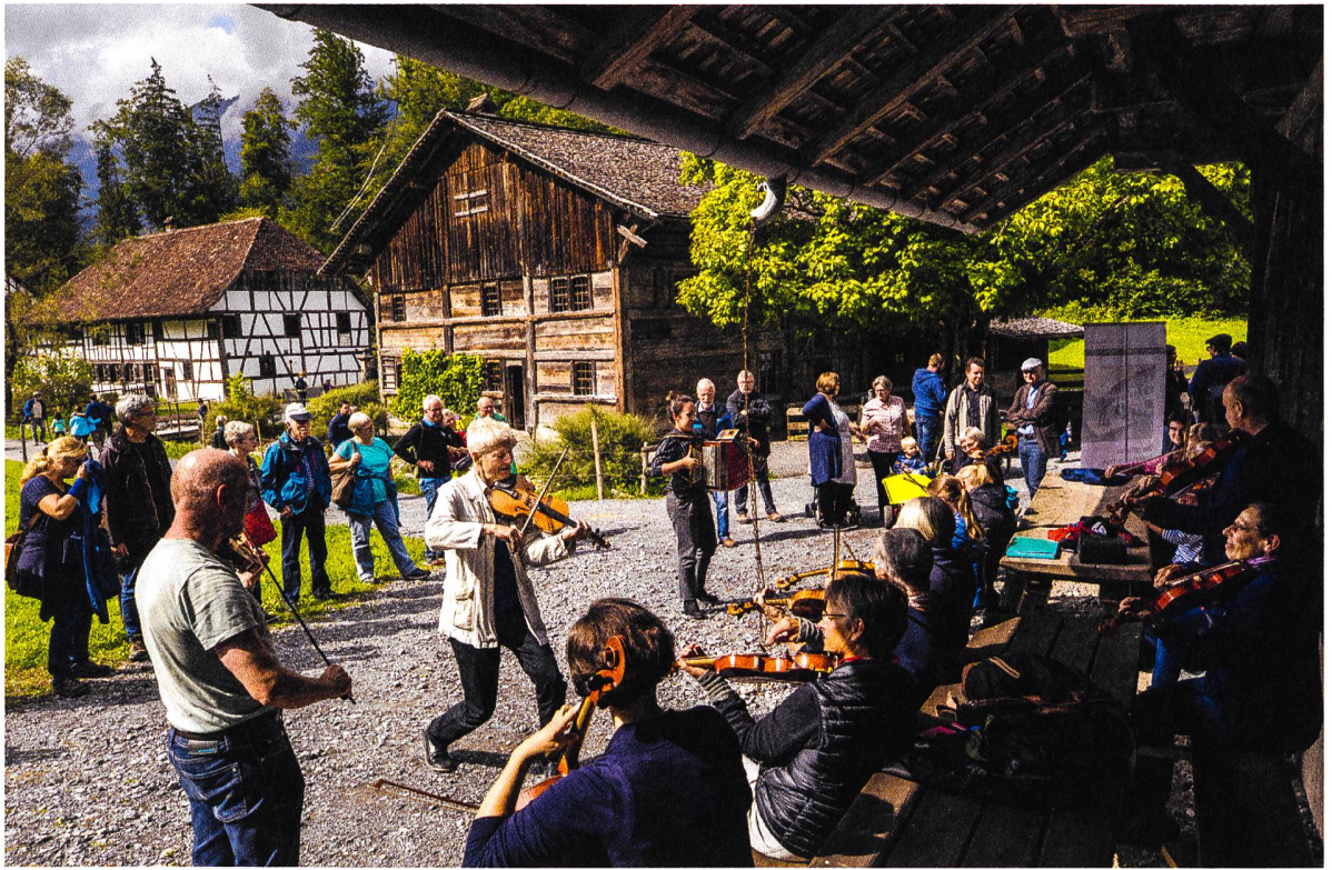
Mitmachen bei den Geigentagen 2018, organisiert durch das Haus der Volksmusik.