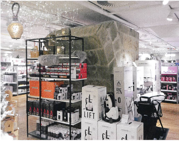
Fig. 6: Fribourg, vestiges médiévaux de la porte de Romont, au sous-sol d'un supermarché.