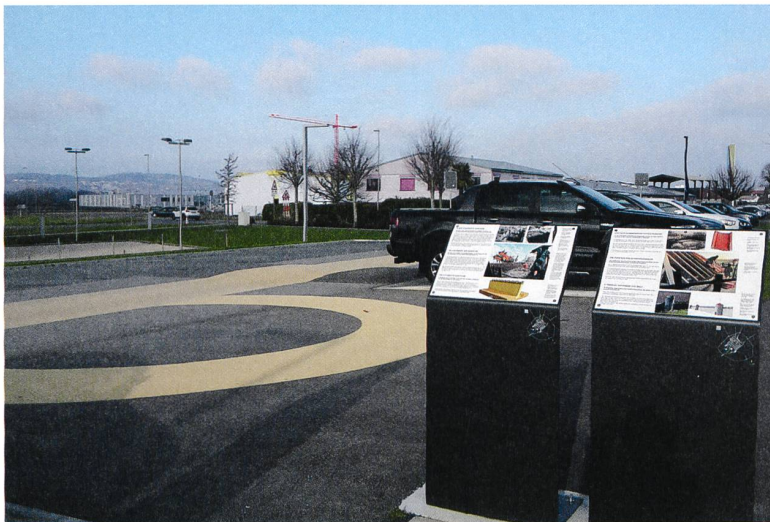
Fig. 3: Avenches/Aventicum, zone sportive. Marquage granulaire jaune du tracé du mur d'enceinte romain et de l'une de ses tours avec panneaux explicatifs.

c'est le cas notamment pour le temple de la Grange des Dîmes (fig. 2). Récemment, une nouvelle zone sportive équipée d'un parking a été aménagée en périphérie de la ville, non loin de la muraille romaine, dont le tracé, à cet endroit, n'est plus visible. Les autorités locales, le bureau d'architecture mandaté, ainsi que les Site et Musée romains d'Avenches, ont décidé d'indiquer le passage du mur romain sur une longueur d'environ 120 mètres au moyen d'un marquage granulaire jaune rappelant la couleur originale du mur en calcaire du Jura. Deux panneaux rendent les promeneurs attentifs à ce marquage, les sensibilisent au monument et leur fournissent les informations historiques indispensables (fig. 3).