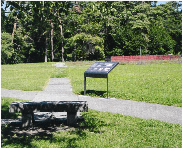
Fig. 7: Genève, Parc de la Grange. Mise en valeur des vestiges dans le cadre d'un concept d'architecture paysagère spécifique pour un agréable lieu de rencontre et de promenade.