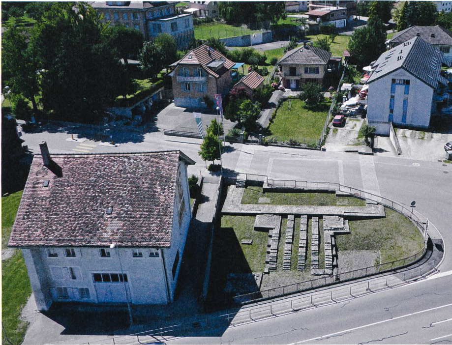
Fig. 2: Avenches/Aventicum. Vue des vestiges du temple de la Grange des Dîmes avec marquage de ses fondations.