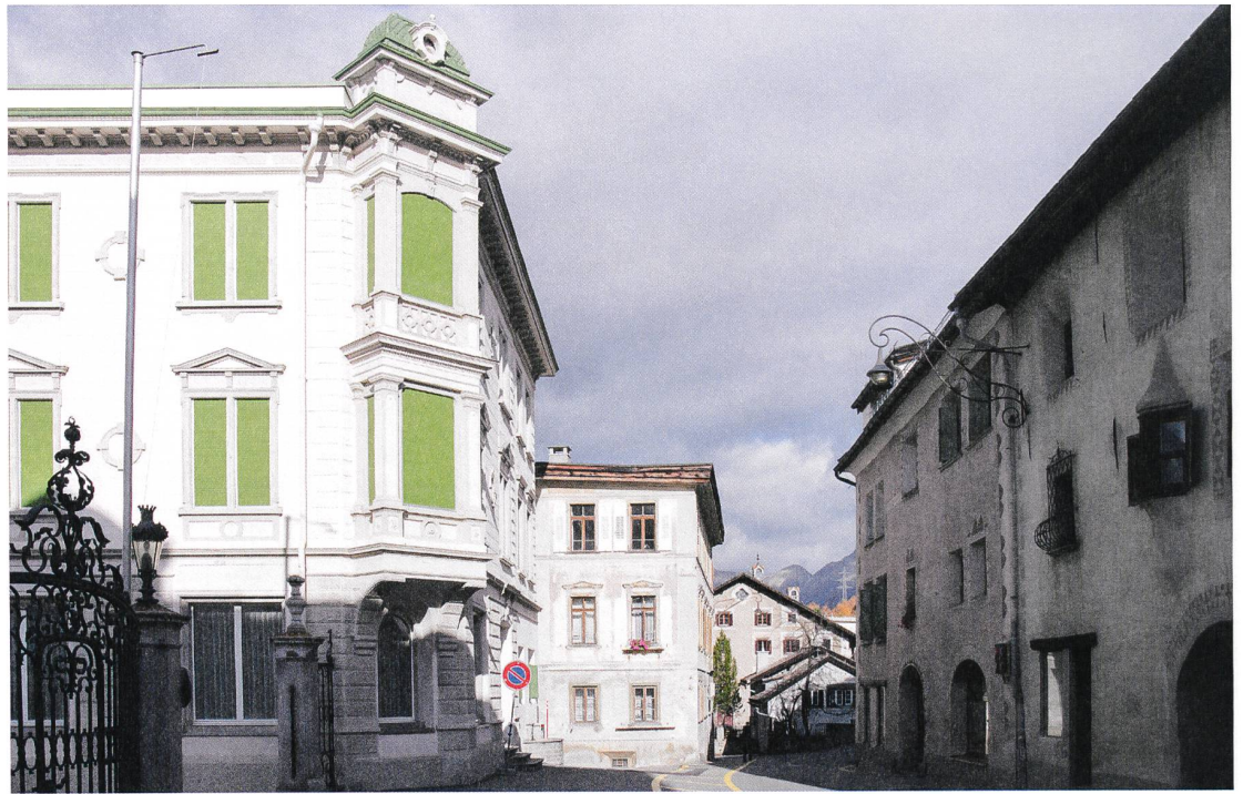
Pontresina (GR)