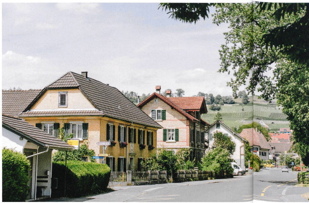
Hallau (SH)