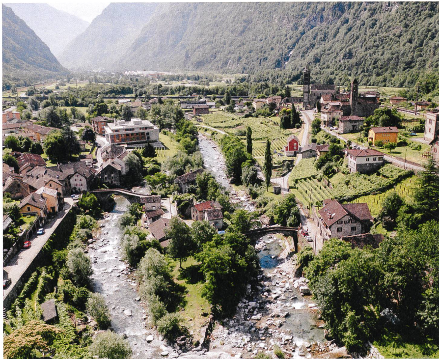
Giornico (TI)