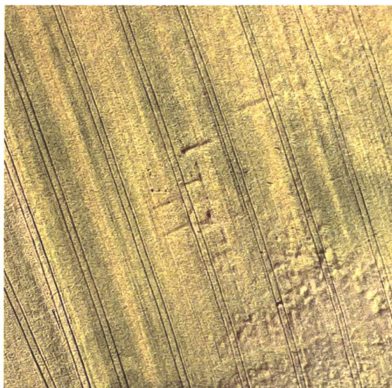
Fig. 4. Vue aérienne de la villa de Barberêche « Fin du Chêne » (FR), juillet 1989.

atmosphériques et de luminosité sont réunies. Les vestiges anthropiques sont alors révélés par les anomalies de croissance des plantes ou des cultures céréalières, par les phénomènes d'humidité, par les différences dans les teintes des sols, ainsi que par les microreliefs visibles lorsque la lumière du soleil est rasante. Les conditions pour ainsi dire optimales sont donc régulièrement réunies lors d'importants épisodes de sécheresse, comme ce fut le cas en 1976 et en 2003. C'est à ces occasions que de nombreux nouveaux sites ont pu être découverts ou alors mieux observés.