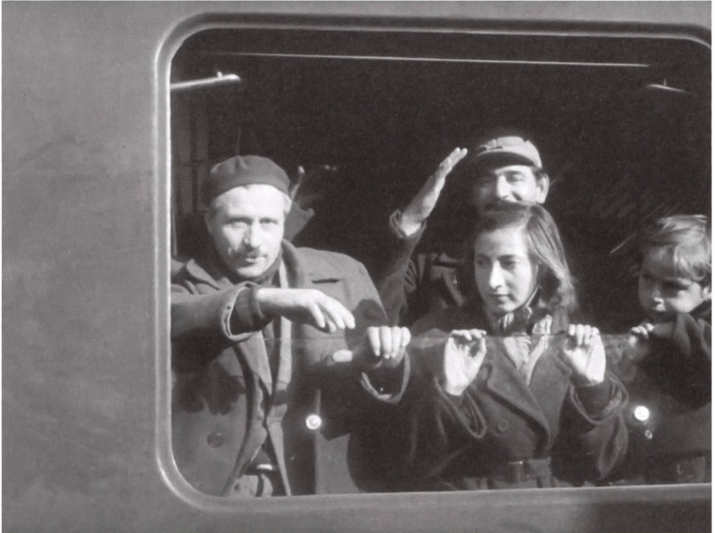
Schweizer Filmwochenschau vom 16. November 1956: Flüchtlinge aus Ungarn (0745-2).