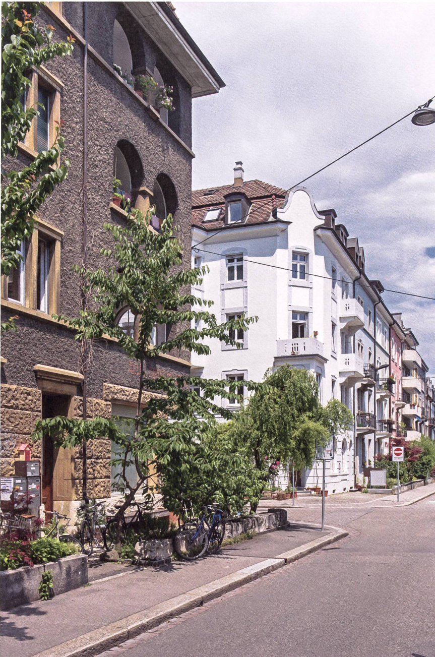
Das untere St. Johann hat noch den Charakter des Arbeiterquartiers: Hohe Wohndichte und architektonische Qualität schlossen sich um 1909–1912 nicht aus.