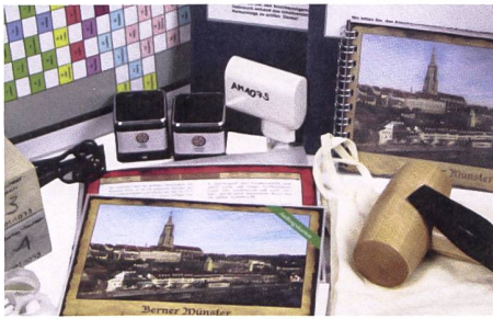
Für Schulen: Ideen zum Berner Münster.

Zum 600-Jahre-Jubiläum des Berner Münsters hat die Pädagogische Hochschule Bern Unterrichtsmaterialien entwickelt, die Einblick in historische, kulturelle und architektonische Besonderheiten des Sakralbaus geben – von seiner Grundsteinlegung bis heute. Damit lassen sich Exkursionen mit Schulklassen zum Berner Münster vorbereiten und durchführen. Die modular aufgebauten Aufträge können thematisch oder chronologisch sortiert werden. Dies erlaubt es den Lehrpersonen, einzelne Aspekte zu fokussieren.