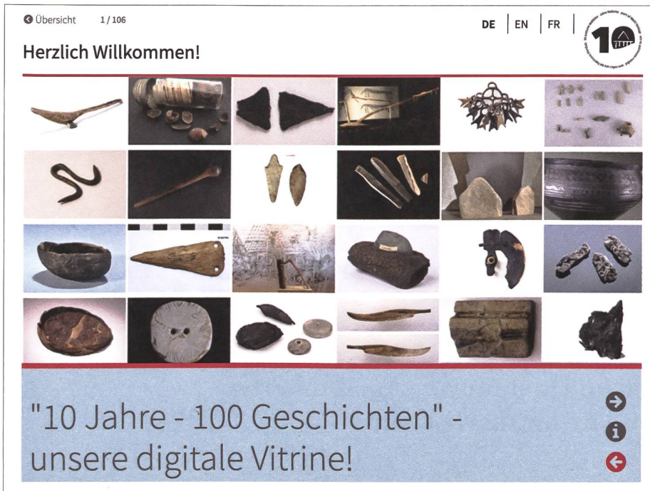
Abb. 6: Die digitale Vitrine «10 Jahre – 100 Geschichten» ist eines der gemeinsamen Projekte der International Coordination Group UNESCO Palafittes und vieler beteiligter Museen aus allen sechs Ländern zum Jubiläumsjahr 2021.

Auf regionaler und kantonaler Ebene wurden sowohl vor Ort als auch digital verschiedene Fundstellen in den Fokus gerückt: Seit 2021 bringt das Archäomobil Ostschweiz unter anderem das Welterbe Pfahlbauten direkt in Gemeinden und Schulen. In Seengen-Riesi (Hallwylsee, AG) steht ein neues Pfahlbauhaus bereit. Die Entdeckungsgeschichte der Fundstelle kann über einen Podcast miterlebt werden. Die Ausstellungsreihe «die-pfahlbauer-in.ch» der Kantonsarchäologie Zürich gab ebenfalls einen umfangreichen und anschaulichen Blick in die Pfahlbauzeit. Mit dem PalaFitFood-Blog aus der Bodenseeregion konnte man das Wissen über Ernährung in der Stein- und Bronzezeit gleich selbst ausprobieren.