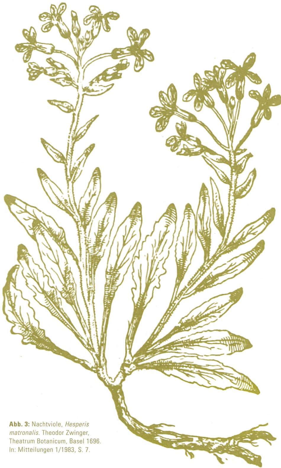
Abb. 3: Nachtviole, Hesperis matronalis . Theodor Zwinger, Theatrum Botanicum , Basel 1696. In: Mitteilungen 1/1983, S. 7.

wie viele Nachfahren der damals angesäten Nachtviolen, Zuckerwurzeln, Violettblättrigen Basiliken, Gelben Randen, des Schlitzmohns, Bauerntabaks, der Haferwurzeln und vieler mehr heute noch in den Gärten der SGGK-Mitglieder zu finden sind. Mit der Samenaktion nahm sich die SGGK bereits sehr früh und ganz praktisch «dem Problem der Rettung von aussterbenden Gartenpflanzen an» 7 , einem auch für die Gartendenkmalpflege bedeutenden Thema, denn Erscheinungsform, Duft und Farbe der Bepflanzung trägt stark zur Authentizität eines Gartens bei – und sein Charakter verändert sich, wenn diese Pflanzen nicht mehr erhältlich sind.