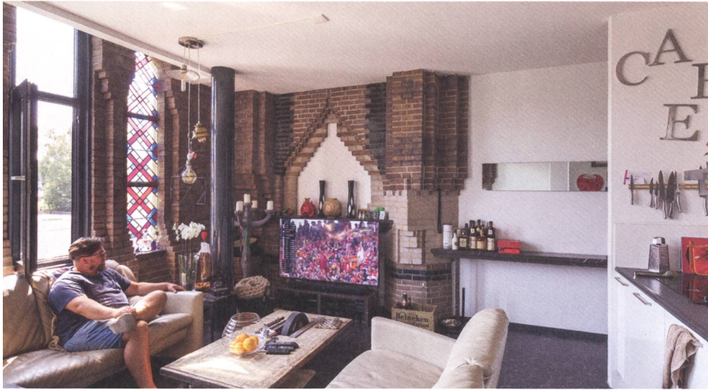
Abb. 6 und 7: Die Mariakerk in Waalwijk (NL) ist zu einem Mehrfamilienhaus ausgebaut worden. Im Inneren der Wohnungen erinnern einzelne Versatzstücke an den ursprünglichen Grossraum.