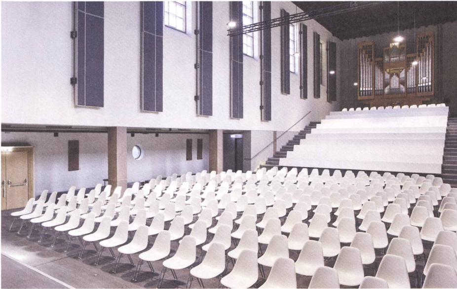
Abb. 3: Die ehemalige römisch-katholische Kirche Don Bosco in Basel ist heute ein Konzertsaal und Proberaum.