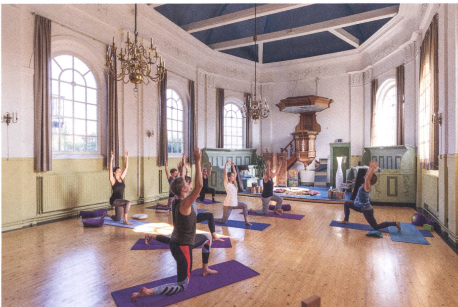
Abb. 5: Die Doopsgezinde Kerk in Akkrum (NL) wurde zum Yoga-Studio umgenutzt.