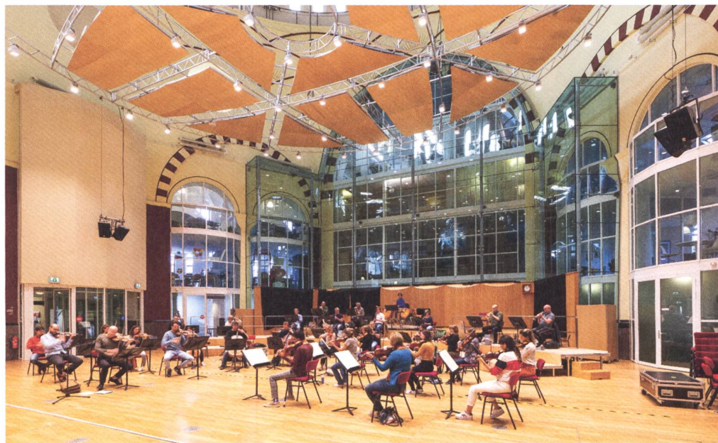
Abb. 4: Die Gerardus Majellakerk in Amsterdam (NL) wurde mehrfach umgenutzt. Heute dient der überkuppelte Kirchenraum als Übungssaal für ein Orchester. Die liturgische Ausstattung ist nicht mehr im Raum.