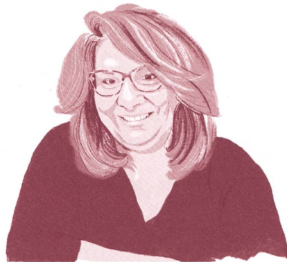
Alexandra Xanthaki , rapporteuse spéciale des Nations Unies dans le domaine des droits culturels.

Dans la mesure où les nouvelles technologies de la communication répandent le savoir et encouragent la créativité, elles constituent un excellent progrès. Toutefois, les grandes compagnies qui les contrôlent – Netflix, Facebook, Amazon, Google, etc. – ont tendance à diffuser uniquement les productions