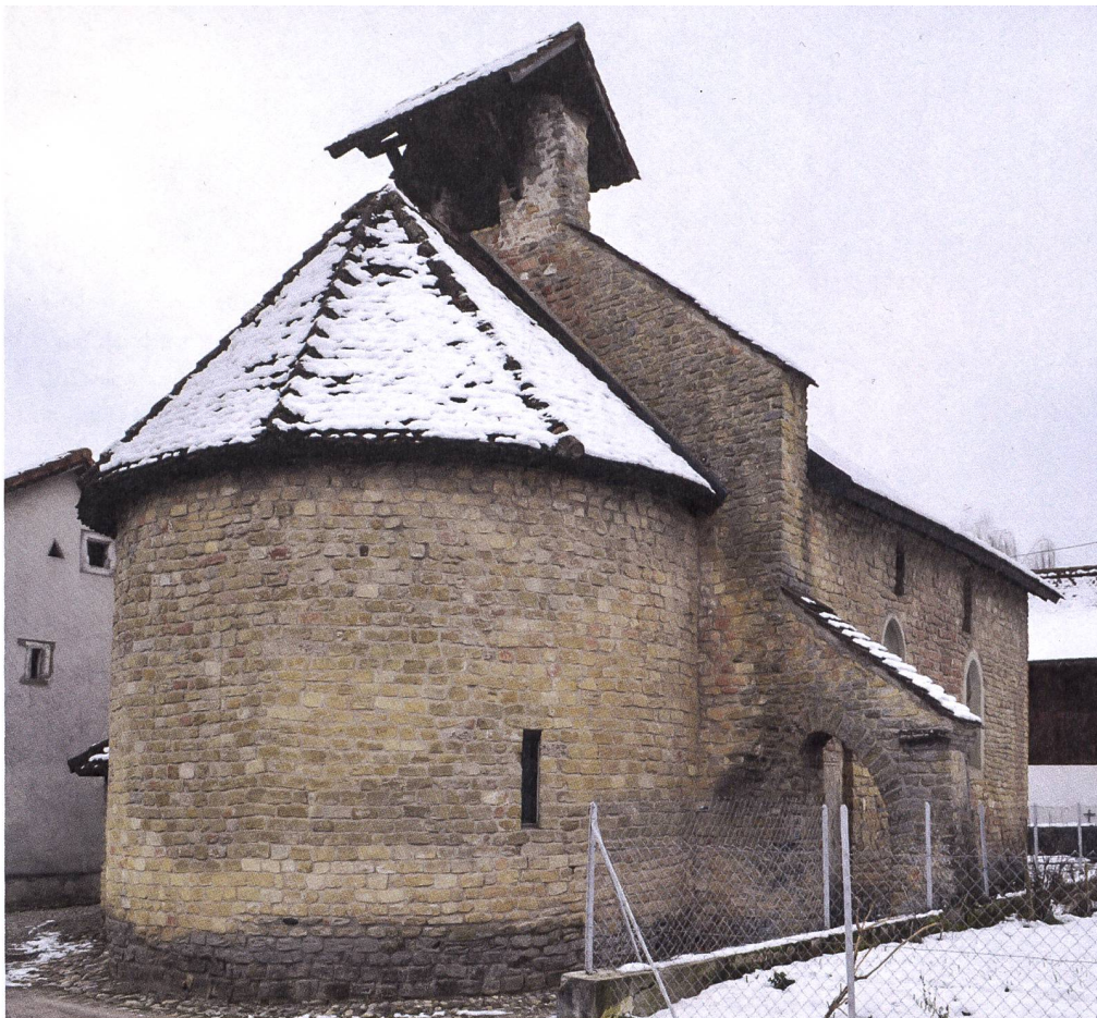
Fig. 5 : Moellons en calcaire jaune en remploi dans l'église romane de Donatyre.

matériaux bruts suit une logique purement pratique et matérielle, celui des ornamenta , en sus de cet aspect de praticité, en recèle parfois un, plus idéologique. Ces blocs « de prestige », associés dans les esprits à la puissance romaine, peuvent ainsi servir à inscrire les autorités d'un lieu dans le prolongement d'un passé prestigieux et à affirmer leur pouvoir. L'exemple le plus connu du monde romain est sans doute l'Arc de Constantin à Rome, construit entre 312 et 315 et remployant des ornamenta provenant de monuments datant de l'apogée de l'Empire, sous les Antonins (96 à 180 ap. J.-C.).