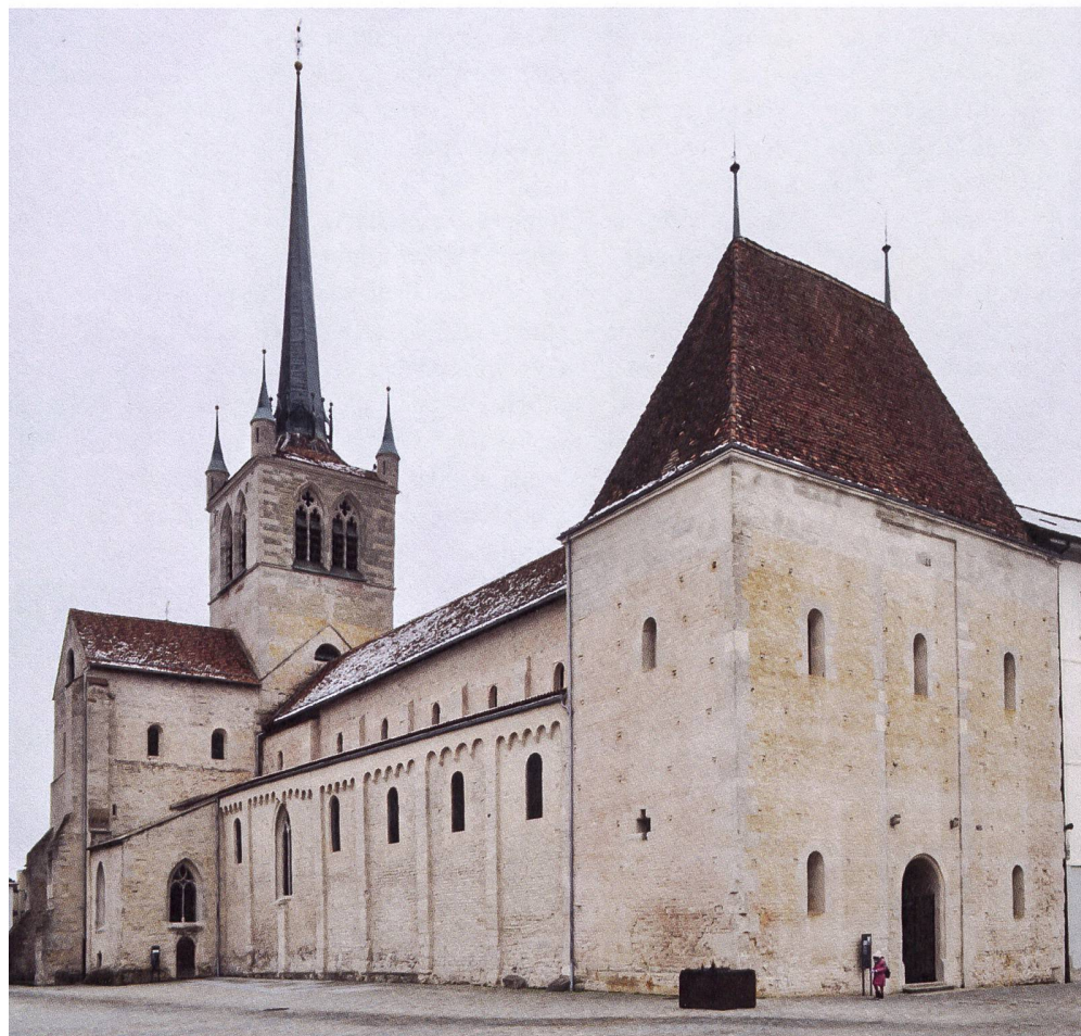
Fig. 7 : Moellons en calcaire jaune en remploi dans l'Abbatiale de Payerne.

De nos jours, la plupart des gisements antiques étant épuisés ou n'étant plus exploités, il n'est plus possible d'y extraire les matériaux nécessaires aux travaux de restauration des principaux monuments de la ville romaine. Comme il n'est, fort heureusement, plus envisageable de démanteler un monument pour en restaurer un autre, l'approvisionnement en pierre (calcaire jaune et grès coquillier) doit se faire dans des carrières, certes plus éloignées, mais dont les matériaux présentent les caractéristiques pétrographiques les plus proches des roches utilisées pendant l'Antiquité 5 . Ainsi, le grès coquillier provient des carrières de Mägenwil (AG) et le calcaire jaune neuchâtelois a été remplacé par la pierre de Jaurmont (ou calcaire de Metz) issue de Moselle (France).