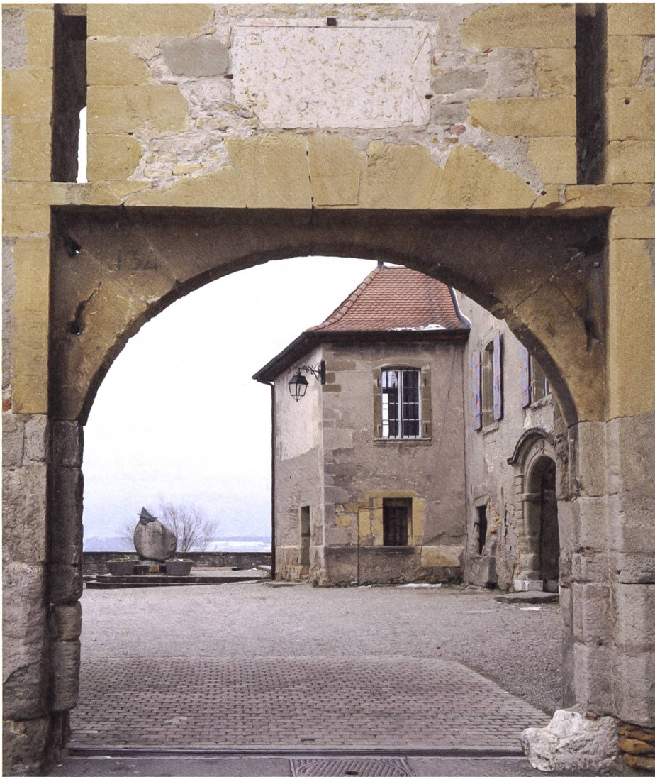
Fig. 2 : Inscription antique surplombant la porte sud du château d'Avenches.