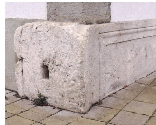
Fig. 3 et 4 : Pilastre en calcaire urgonien en emploi dans l'angle nord-est de l'Auberge de la croix blanche à Domdidier.