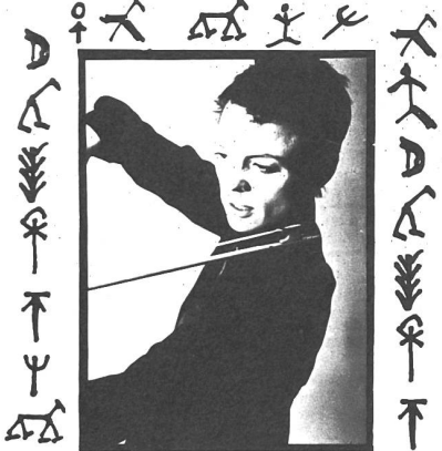
Laurie Anderson singt auf ZOOLOOK mit

jüngste Komponist in der mehrhundertjährigen Geschichte der Pariser Oper, der sein Werk darin aufführen durfte. Mehr noch, die Aufführung von "Aor" war die erste grosse Synthie-Vorführung in Europa überhaupt. Dementsprechend waren auch die Reaktionen. Jarre wurde in den Himmel gelobt, das Ballet geriet darüber ganz in den Hintergrund. Jarre's Musik war das Tagesgespräch