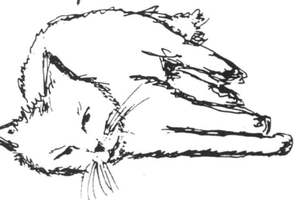
Bericht: MARIANNE GRUNDER (Merci! die Red.) Gestaltung: Martin