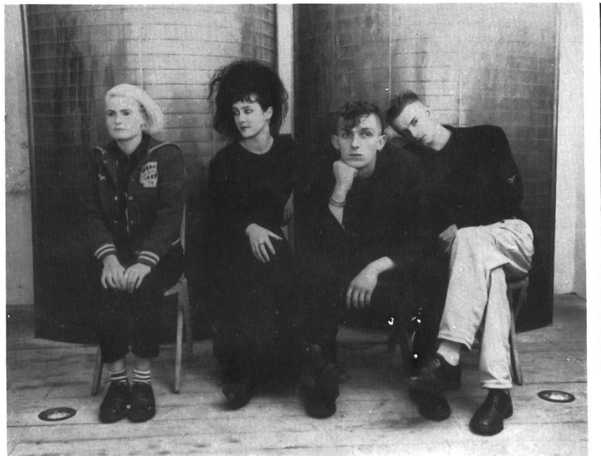
THE FRAZIER CHORUS