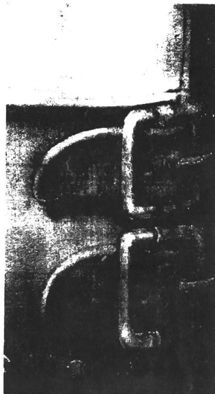
BIOMECHANOID by H.R. GIGER