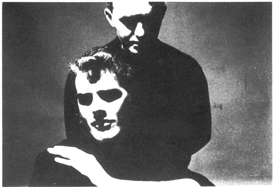
PHILADELPHIA FIVE KK Rec. 007 Heaven 12"

Belgien Brüssel, Deutschland Frankfurt, das ist Florenz für Italien: Die Metro-pole, wo auch die Infrastruktur stimmt, um neue Ideen, neues Soundverständnis geschehen zu lassen. Nur hier treffen in Italien die unterschiedlichsten Einflüsse, Ursprünge und Soundphilosophien aufeinander; durchmischen sich, ergänzen sich und erzeugen ein Neues, ungeahnt vielfältiges Betätigungsfeld für zukunftsorientierte Experimentalisten. Der Sound der dabei entsteht, dürfte auch im europäischen Vergleich neue Massstäbe setzen. RINF sind nur ein kleines Rädchen in dieser nicht mehr zu stoppenden Maschinerie, aber bestimmt nicht eben das Unwichtigste. RUBBER ON RIDER - nach HEAVEN von PHILADELPHIA FIVE ganz eindeutig das Ueberzeugendste, was mir diesen Monat zu Ohren gekommen ist. Sebastian Koch