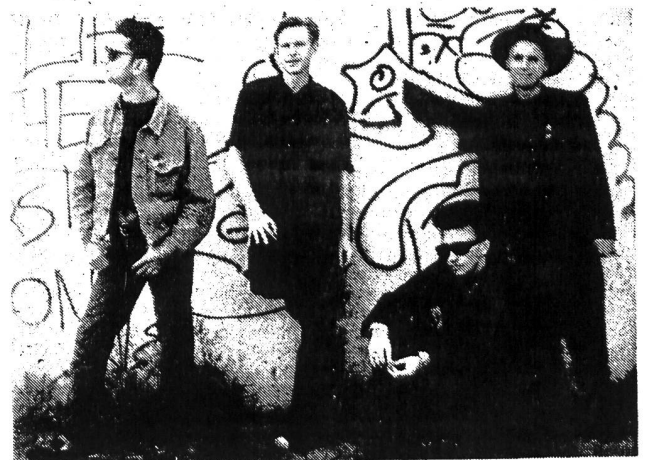
Die englische Band Depeche Mode gab am Montag zum FDJ-Geburts-tag ein von Tausenden Fans bejubeltes Konzert in der Berliner Werner-Seelenbinder-Halle. Dave Gahan, Andy Fletcher, Martin Gore und Alan Wilder begeisterten mit einem tollen Sound