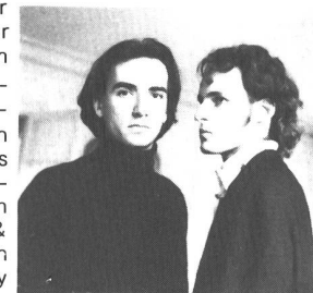
touch el arab: zum Duo geschrumpft

Zuerst war immer nur die Rede von einer bevorstehenden Operation, doch nun wurde es offiziell bestätigt: Cevin Key, Kopf & Motor von Skinny Puppy hat die Band endgültig verlassen - die gesamte Europa-Tour musste so wieder abgesagt werden. Schade!