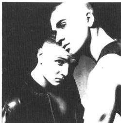
nitzer ebb: hearts & minds