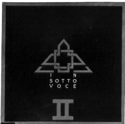
↓↑ IN SOTTO VOCE II

Eigentlich die Platte für alle PANKOW Fans, wäre da nicht dieser äusserst "intelligente" Text, der zu 90% aus der tausendfachen Wiederholung des Satzes "Move your Body, Shake your Body" besteht.