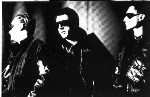
F242 und die göttlichen PANKOW zur Zeit gross im Kommen in USA!