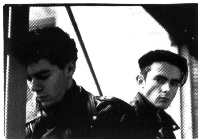
NITZER EBB / SEANCE 25./27.2.1989 - Zürich - StuZ