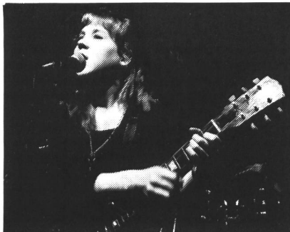
Kristin Hersh