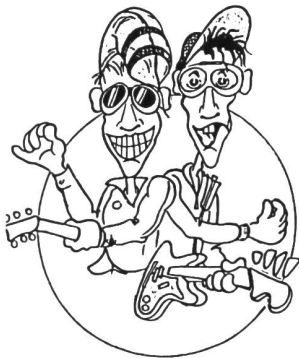
LUDWIG VAN 88 & WASHINGTON DEAD CATS 10.2.1989 - Zürich - StuZ

Am Freitag war "Française-Punk" der besten Sorte angesagt. "Ludwig..." ist nach "Bérurier Noir" wohl die zweitbekannteste französische Punk-Band. Mit etwas Verspätung fing die Vorgruppe zu spielen an. Schon nach einigen Takten stellte ich fest, dass es höchste Zeit war, eine Bildungslücke zu stopfen und zwar mit dem Namen "Washington Dead Cats". Was hier die fünf Franzosen live boten, war "Fun-Punk" wie es sich gehört!