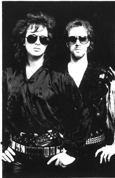
A SPLIT SECOND & ART SOUND verlosen insgesamt 3 von allen Bandmembers signierte LPs "From the Inside". Beantwortet die untenstehende Frage richtig...

du misst sehr "individualistisch" sein, um gegen die belgische Presse ankämpfen zu können, denn sie ist sehr gitarrenorientiert. Nun achten sie aber auch auf die New Beat-Szene, weil sie um diese nicht mehr herumkommen; die Verkaufszahlen sind einfach zu hoch. Bands wie "Front 242" finden sich jetzt auch in der Presse. Allerdings ist der mainstream in Belgien sehr anti-elektronisch eingestellt: Entweder sie schmeissen dich in die New Beat-Schublade, sodass sie dich gleich auf den Müll werfen können, wenn New Beat vorbei ist, oder sie sagen, du wärst nur eine weitere Front 242-Kopie, was nicht sehr aufbauend ist für eine Band, die eine eigene Identität entwickeln will.