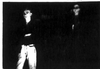
CAT RAPES DOG mit zwei brandneuen Tracks auf der nächsten NL-Single in N.47