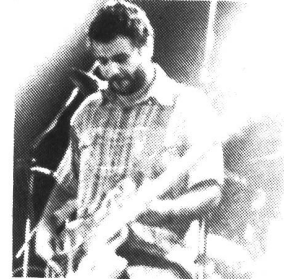
PALE SAINTS/BAND OF HOLY JOY/ EINSTÜRZENDE NEUBAUTEN 19.09.1989 - London - Astoria Theatre