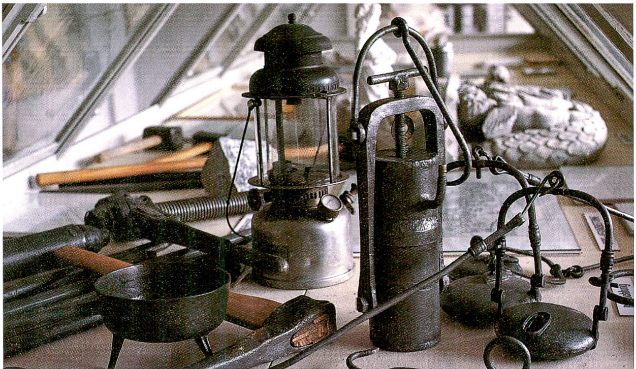
Abb. 31: Bergmannswerkzeug im Gipsmuseum Schleithem-Oberwieschen.