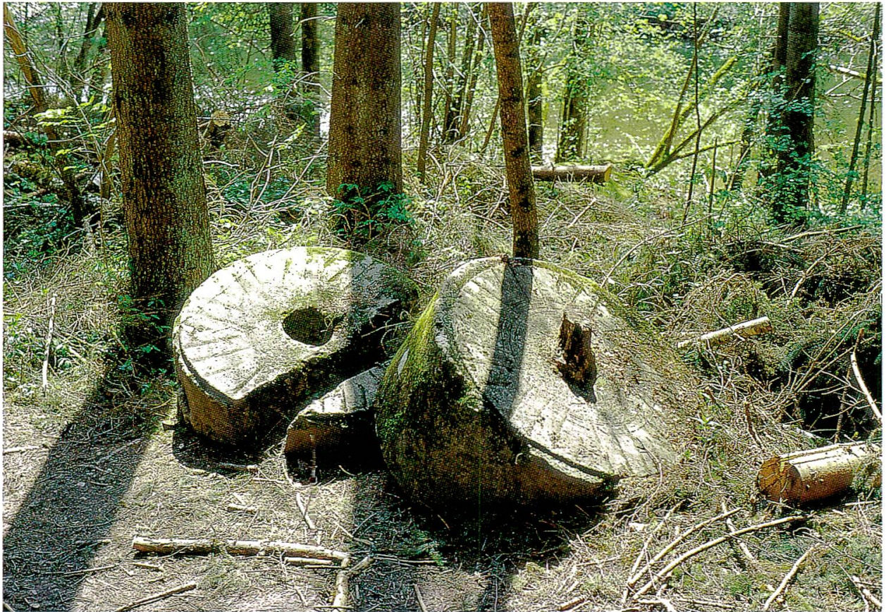
Abb. 32: Am Wanderweg in den Flühen erinnern stumme Zeugen an die 1891 vom Hochwasser zerstörte Moggerenmühle.

den Maschinen ausgespuckten Artikel diente. 1947 wurde die Turbine des Kleinkraftwerks erneuert. Nicht zuletzt die Einführung neuer Vorschriften für Restwassermengen in Fliessgewässern aber führte 1991 zur Stilllegung der alten Anlage. Die Staustufe beim Kanaleinlauf konnte so aufgeschüttet werden, dass sie für Wanderfische passierbar wurde.