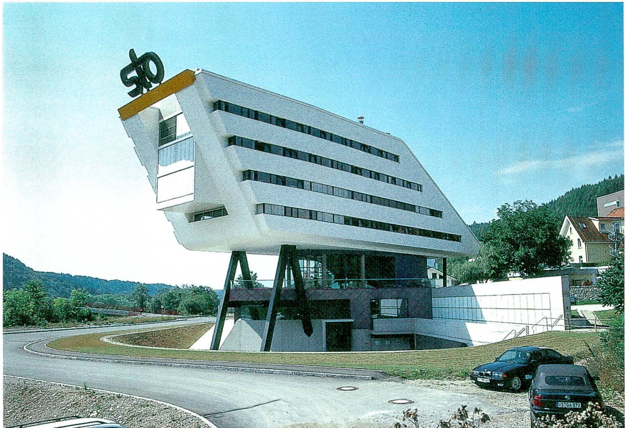
Abb. 33: Das Kommunikations- und Marketingzentrum der Firma Sto AG in Stühlingen-Weizen.