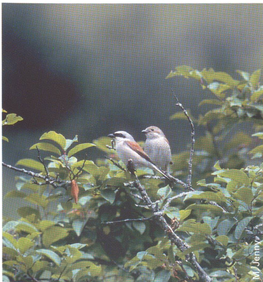
◀◀ Das Neuntöter-Männchen ist an seinem rotbraunen Rücken und der schwarzen Augenbinde erkennbar.

Kanton SH 51 – 200 ▼ Schweiz 20 000 – 25 000