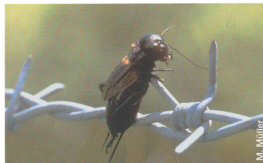
◀ Ein typisches Verhaltensmerkmal beim Neuntöter ist das Aufspiesen von Beutetieren. Dies ermöglicht ihm, die Beute leichter zu zerteilen. Zudem kann er sich so auch einen Vorrat für schlechte Zeiten anlegen.