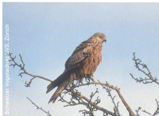
Schweizer Vogelschutz SVS, Zürich

Rotmilane bevorzugen als «Steppenvögel» reich strukturierte, offene Landschaften der Niederungen. Der Horst wird am Waldrand