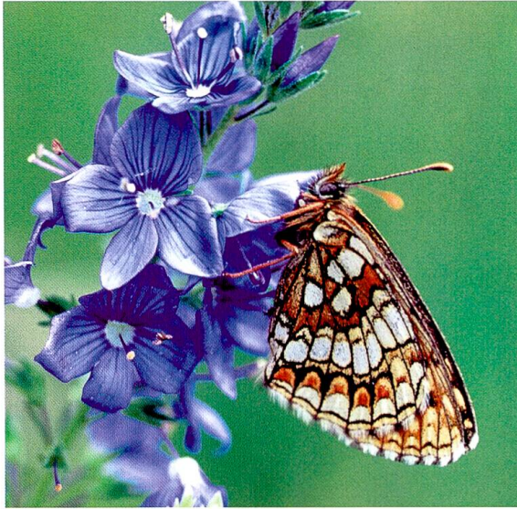
7 Östlicher Scheckenfalter an Ehrenpreis, einer seiner Raupennahrungspflanzen. Dieser Schmetterling kommt in der Schweiz wahrscheinlich nur im Randen vor und ist auch hier selten.

Schaffhausen eine besondere Verantwortung, so für das Rötliche Fingerkraut ( Potentilla heptaphylla ), die Gewöhnliche Küchenschelle ( Pulsatilla vulgaris ) und den Schwarzwerdenden Geissklee ( Cytisus nigricans ).