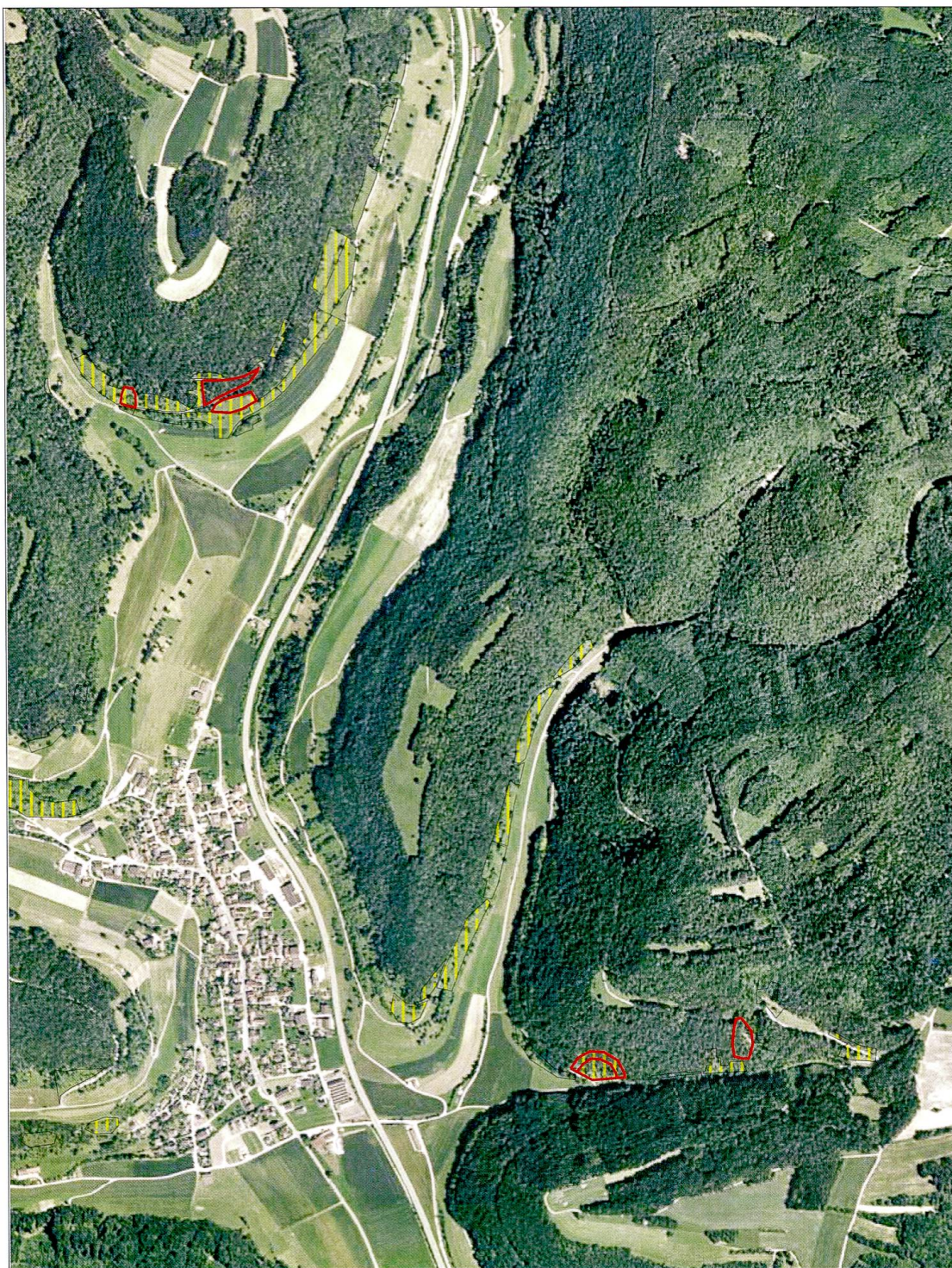
Abb. 25: Verbreitung des Hainveilchenperlmutterfalters