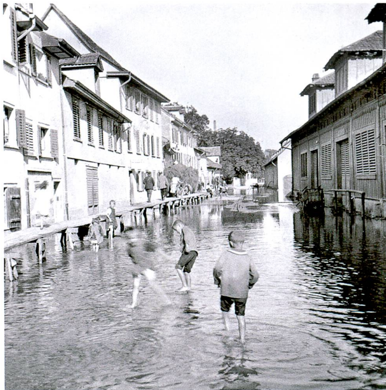
9 Überflutete Fischerhäuserstrasse, 1924. Bis weit ins 20. Jahrhundert hinein waren Hochwasserereignisse am Rhein nicht allzu selten.

Wetter: Die Niederschlagsextremwerte werden auf der Alpennordseite um bis zu 20% zunehmen (Fig. 9). Im ungünstigsten Fall muss mit einem Extremereignis, das heute alle 100 Jahre erwartet wird, in Zukunft alle 20 Jahre gerechnet werden. Extreme Niederschläge können nicht nur Schäden durch Überschwemmungen verursachen, sondern sie können auch unerwünschte Auswirkungen auf die Grundstück- und Siedlungsentwässerung sowie auf die Abwasserreinigung haben.