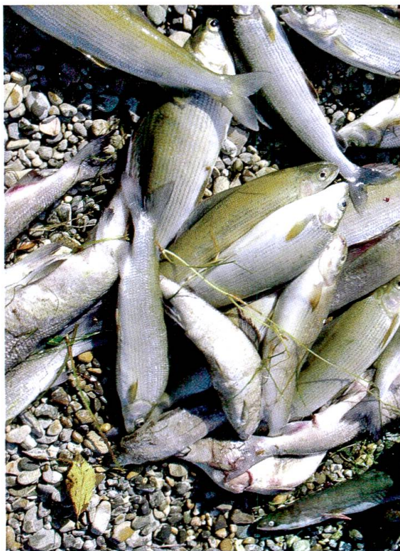
8 Äschensterben im Hitzesommer 2003 aufgrund des warmen Rheinwassers.