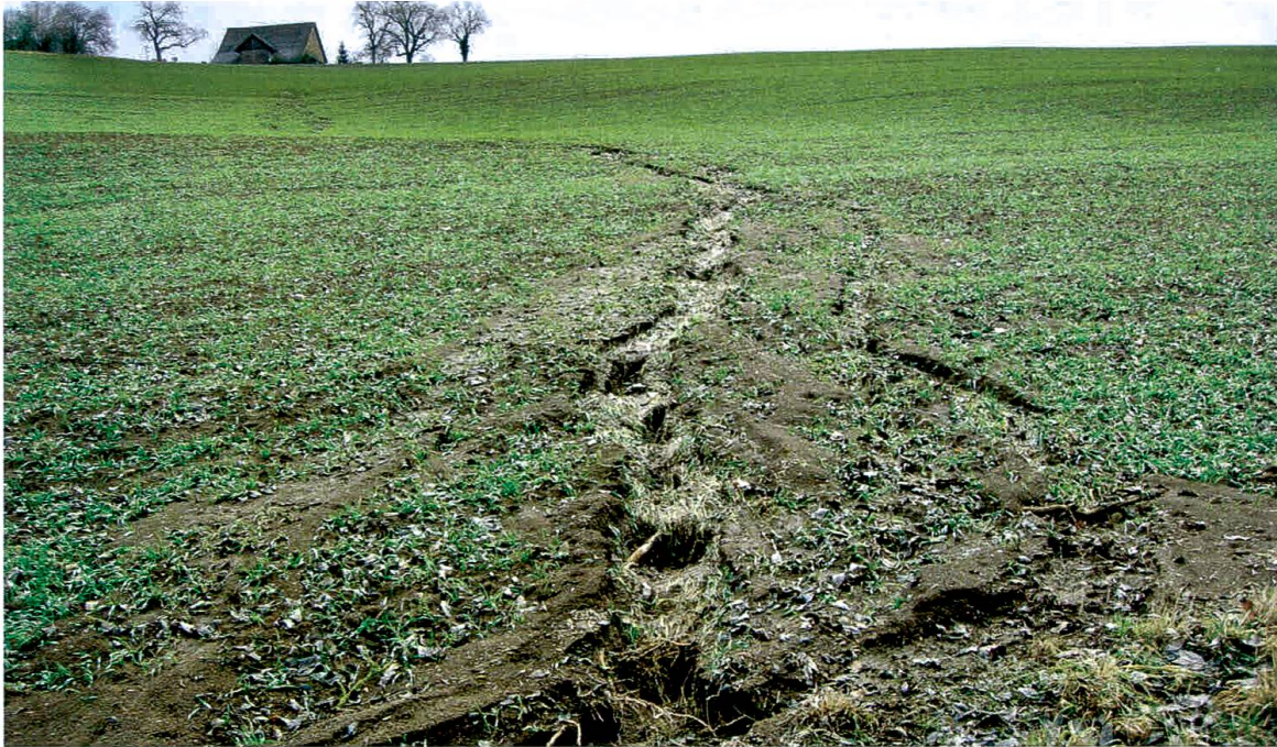
11 Bodenausschwemmung (Beispiel aus dem Kanton Schaffhausen).

Gesundheit: Mehr als eine Milliarde Menschen hat keinen Zugang zu sauberem Wasser, und mehr als 2.5 Milliarden haben keinen Zugang zu adäquaten sanitären Einrichtungen (in Entwicklungsländern sogar jede zweite Person). Jedes Jahr sterben gegen 2 Millionen Menschen an den direkten oder indirekten Folgen von verseuchtem Wasser oder unhygienischen Zuständen. Rund 80% aller Krankheitsfälle in Drittweltländern stehen gemäss WHO im Zusammenhang mit verschmutztem Wasser.