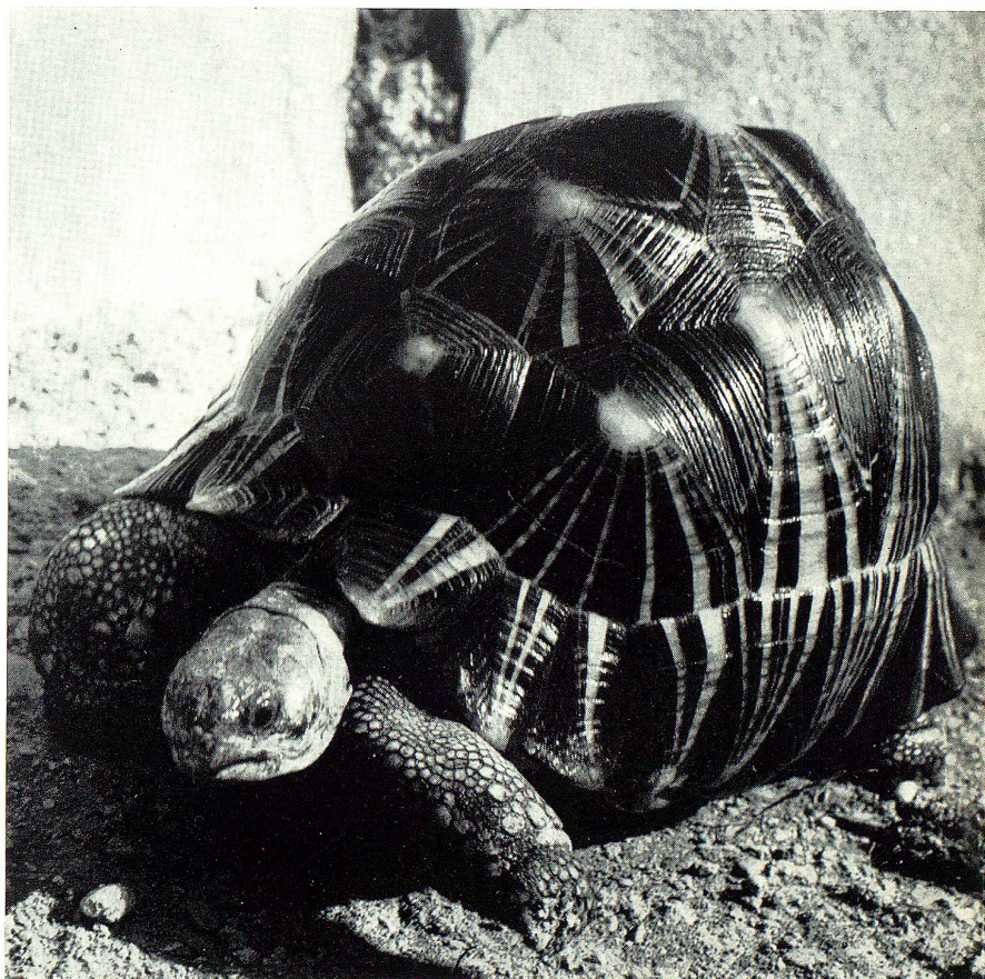
Strahlenschildkröte aus Madagaskar.