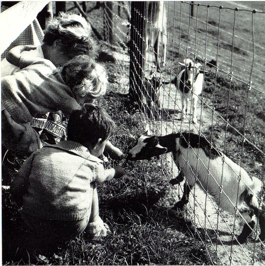
Kinder spielen mit afrikanischen Zwergziegen.