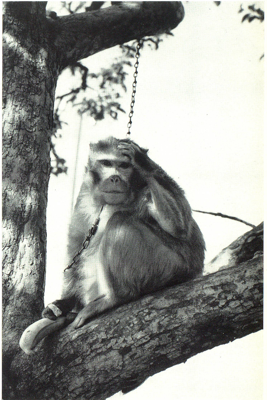
Was sieht und denkt er wohl? Coco, der Resusaffe, bei der Mahlzeit.

Es ist alles ein wenig improvisiert, dem ganzen Drum und Dran haftet noch der Hauch des Romantischen an. In der ehemaligen Remise sind die Schaukästen für Schlangen, Echsen und Spinnen. Dort, wo einst die Kühe gemolken wurden, ist das Nachtquartier für Löwen, Wölfe und Affen eingerichtet. Im Bärenzwinger streiten sich drei Jungtiere um ein zugeworfenes Rübli, und im Affenhaus tummeln sich die Schimpansen, die, Kindern gleich, gehegt und gepflegt werden müssen. Aus dem Beginn mit drei Zwergziegen ist eine stattliche Herde von 15 Tieren geworden. Die Känguruhs zeigen ihre munteren