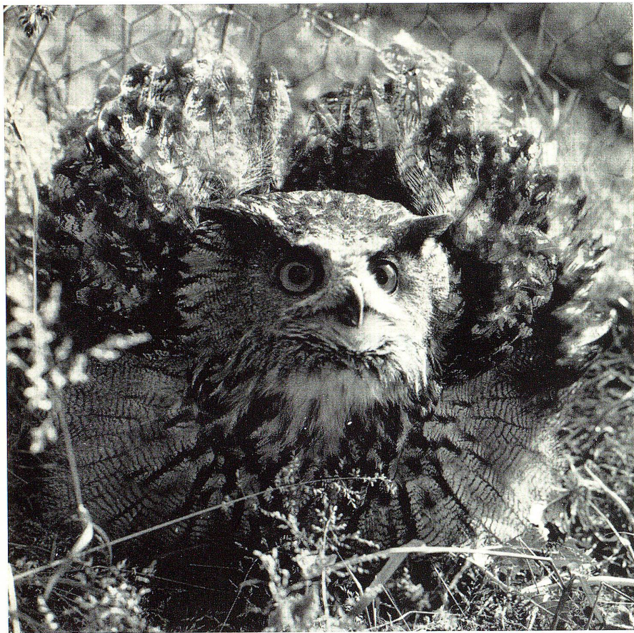
Der Uhu stellt sein Gefieder; er will uns imponieren.

Türe anklopfte, gab es eine interessante Zoologie-Stunde.