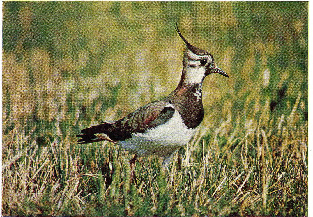
13 Kiebitz (siehe Seite 15)