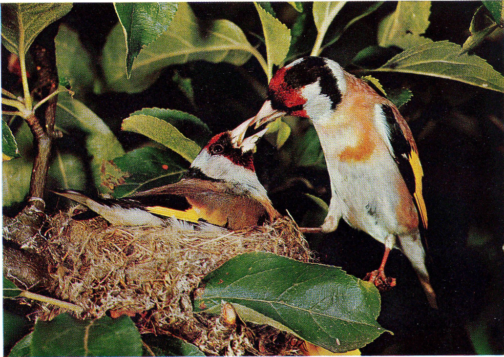
Distelfink (siehe Seite 4)