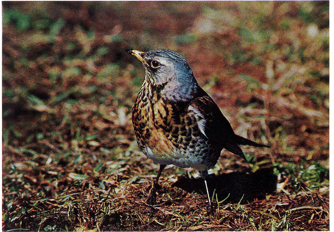
Wacholderdrossel (siehe Seite 7)