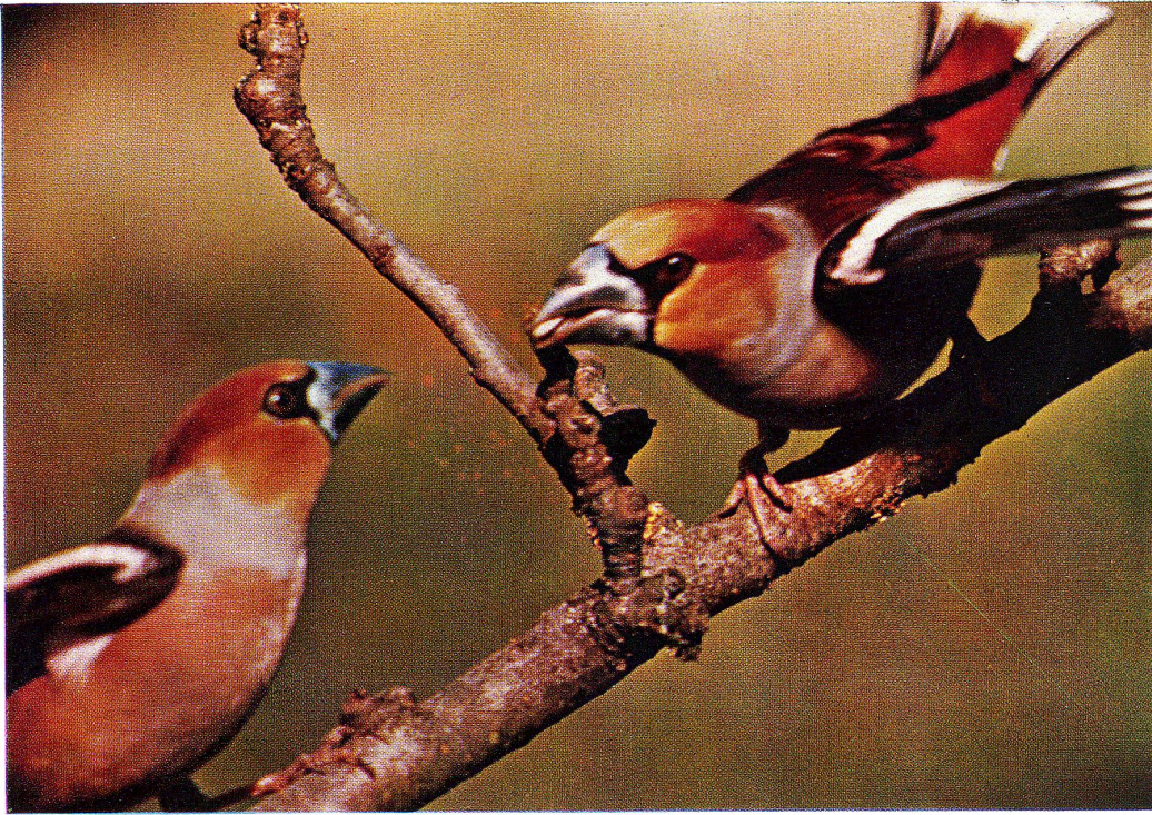
Kirschkernbeißer (siehe Seite 4)