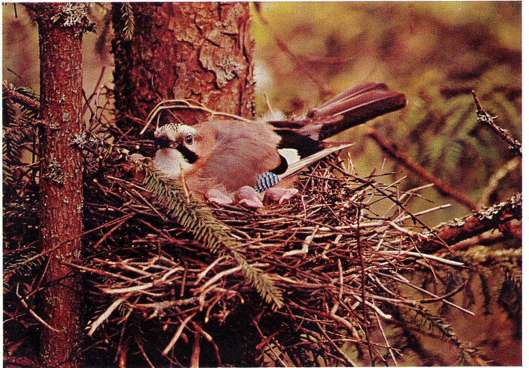
Eichelhäher (siehe Seite 7)