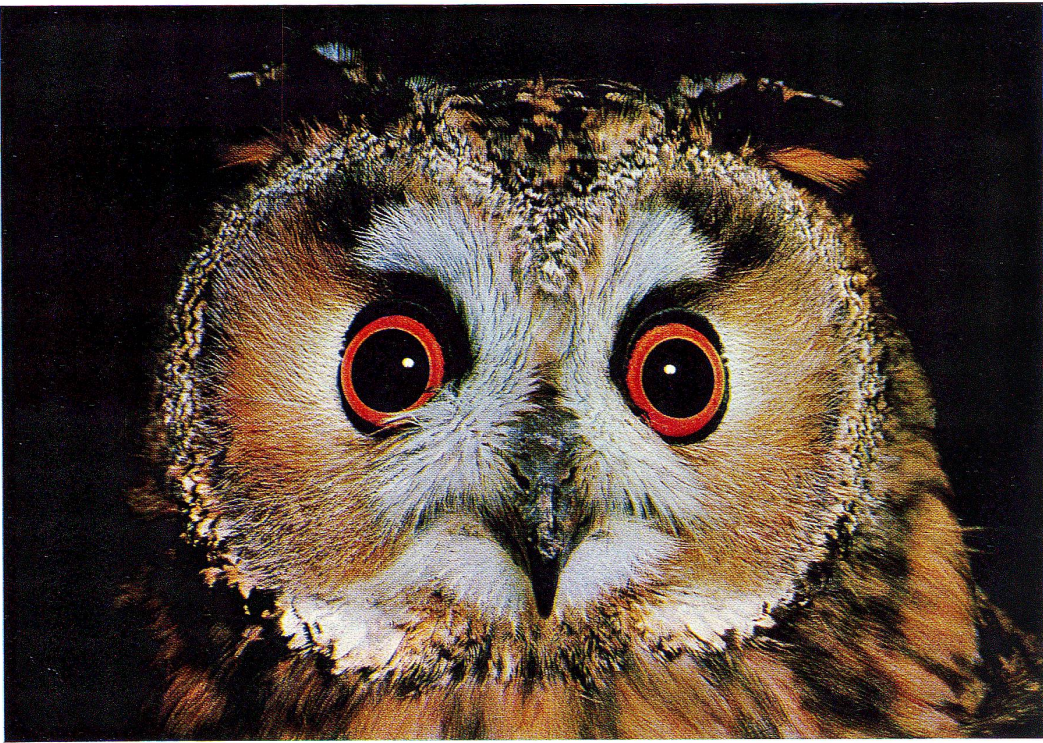
Waldohreule (siehe Seite 11)