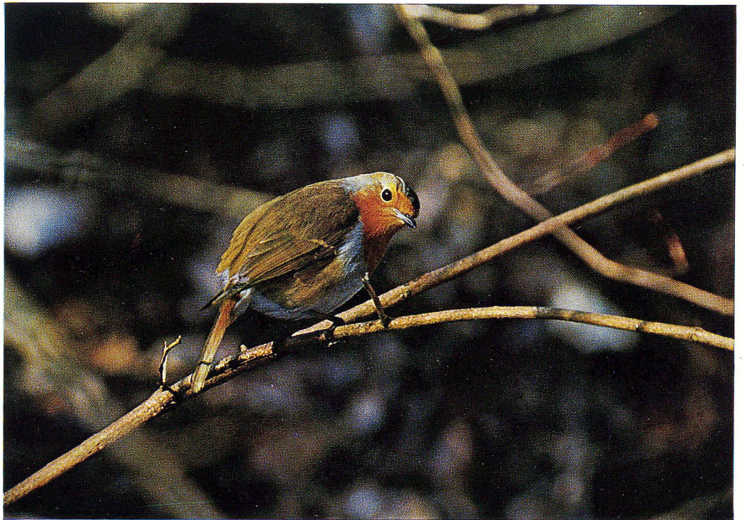
Rotkehlchen (siehe Seite 3)