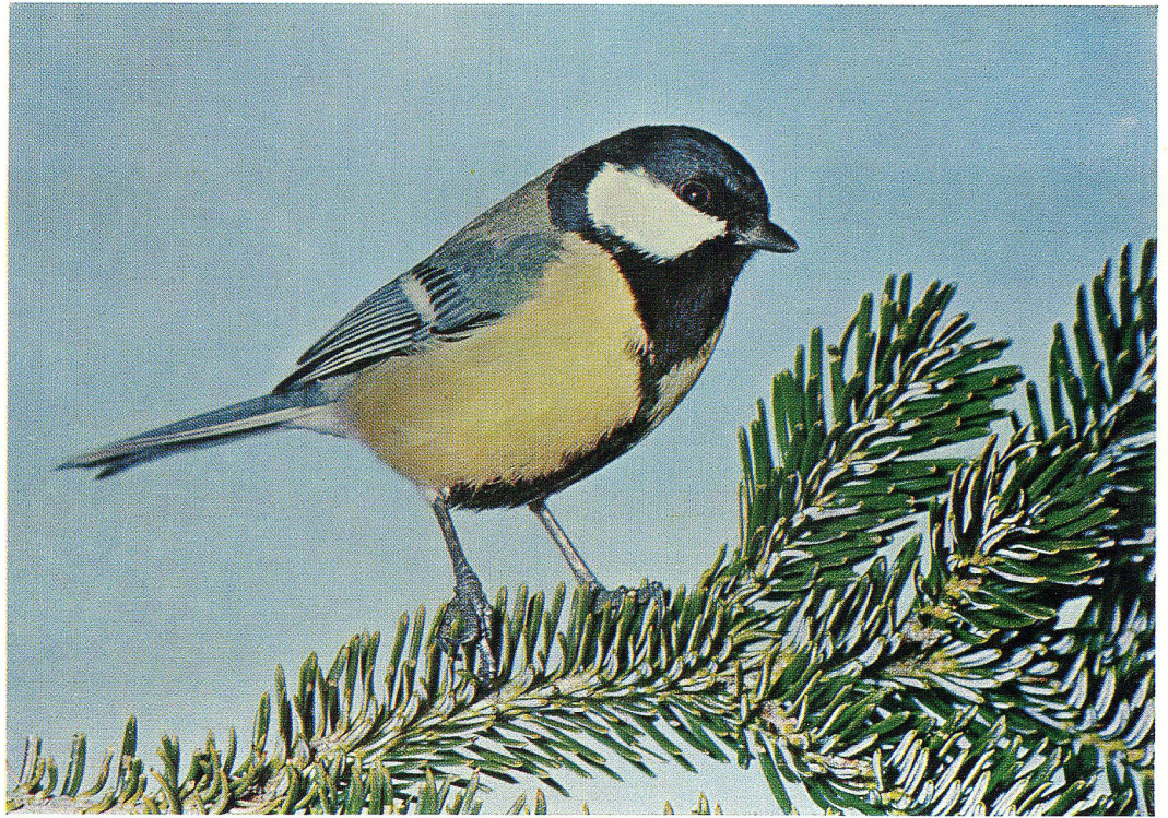
Kohlmeise (siehe Seite 3)