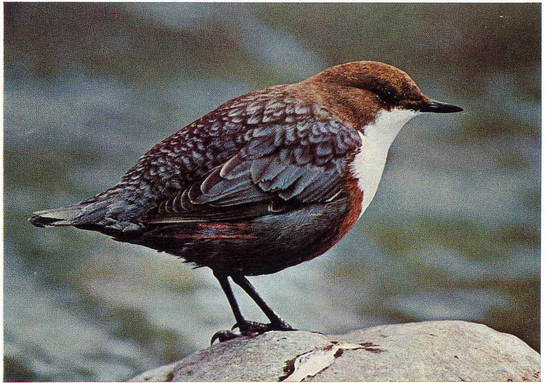
Wasseramsel (siehe Seite 12)