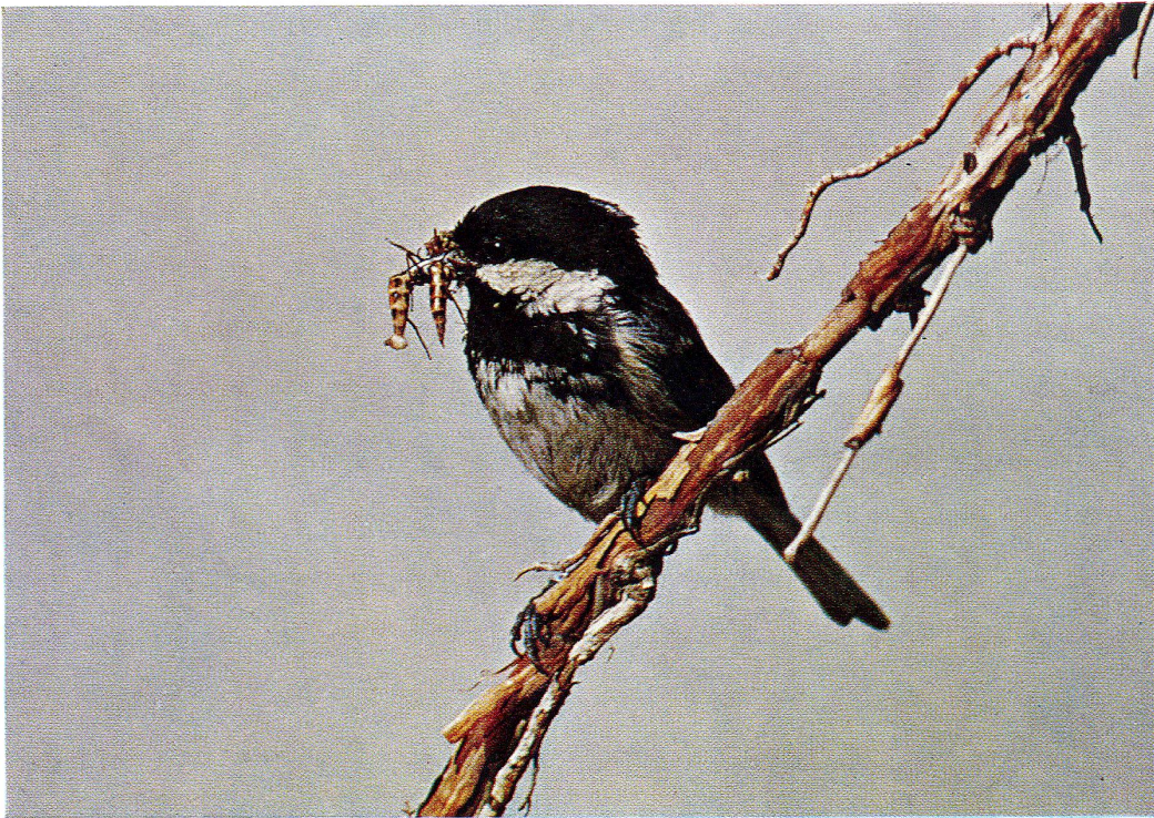
Tannenmeise (siehe Seite 11)