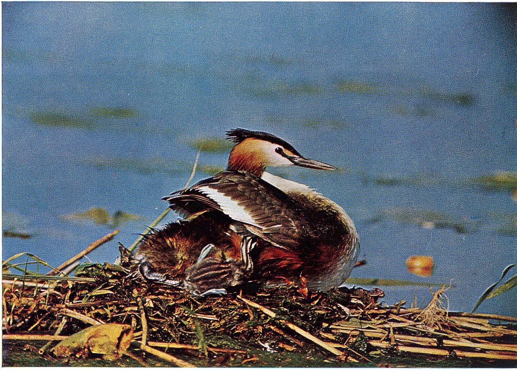
Haubentaucher (siehe Seite 15)