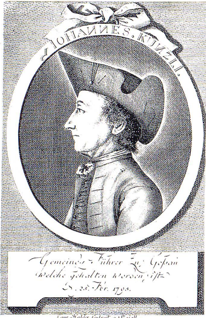
Stich aus der Originalschrift, welche sich im Staatsarchiv St.Gallen befindet.