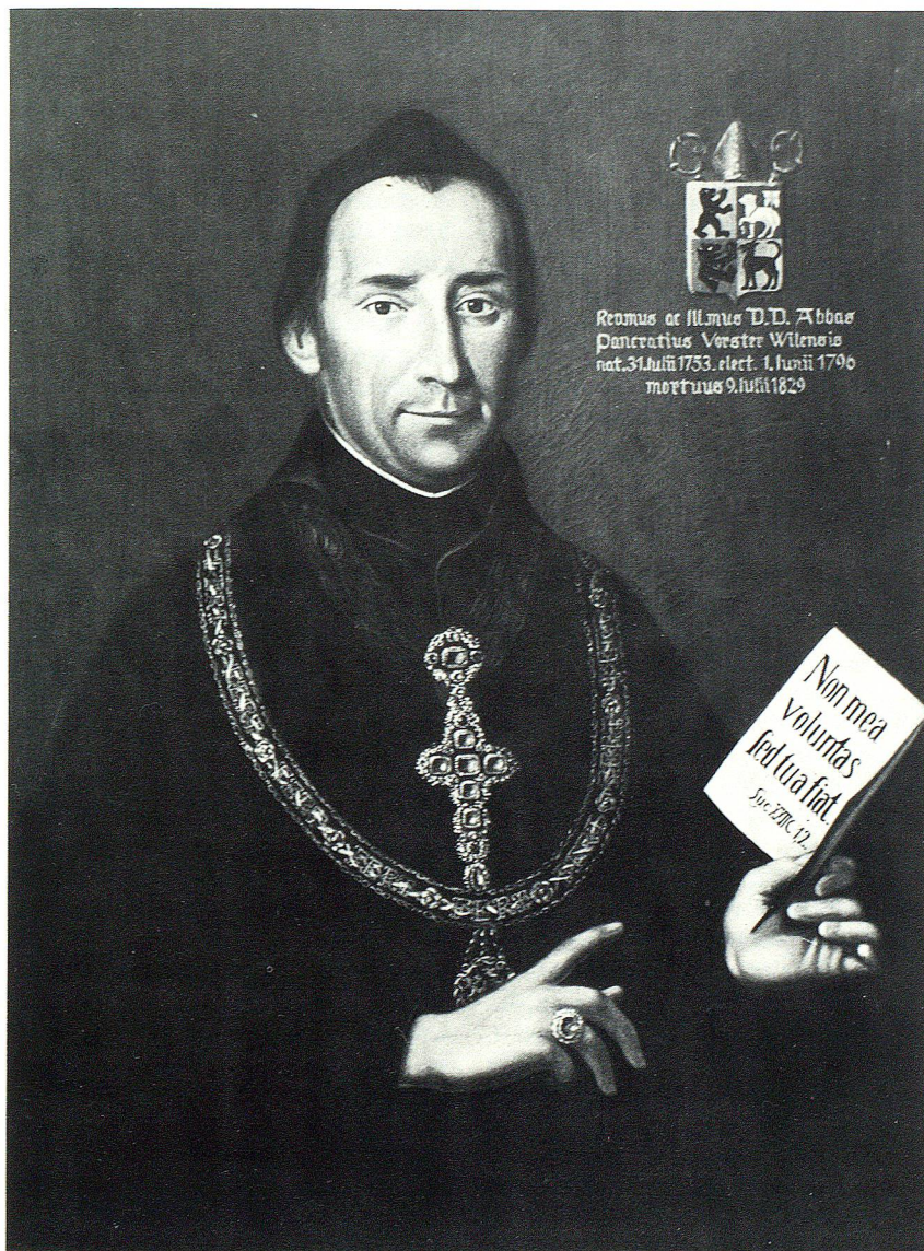
Porträt Abt Pankraz Vorsters im Stiftsarchiv St.Gallen (Kopie), 62×87 cm.

eingeleitet. Immerhin bildeten die Katholiken die Mehrheit im neuen Kanton St.Gallen.