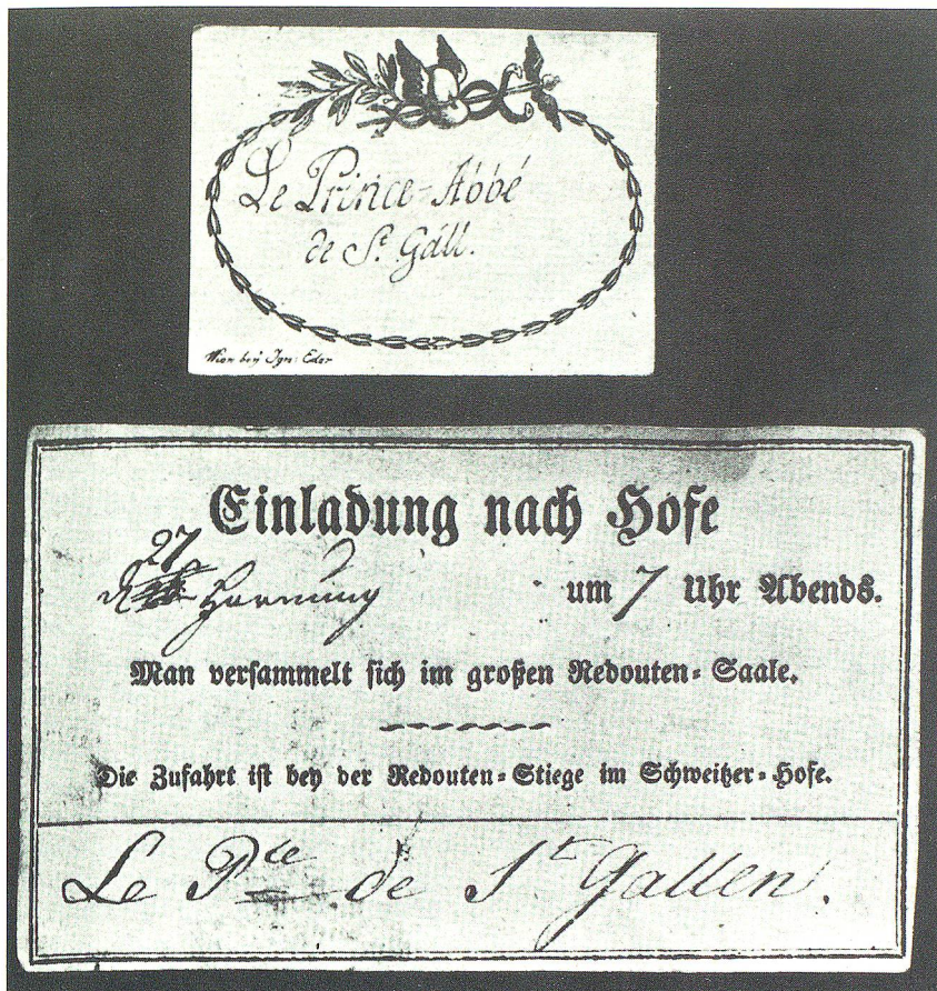
Oben: Tischkärtchen für den St. Galler Abt, vielleicht von diesem Anlass.