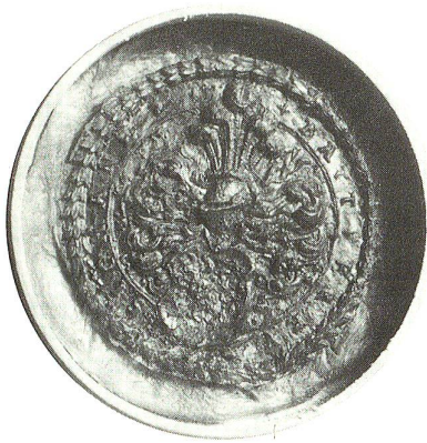
Siegelabdruck des Vogtes (Original im Stiftsarchiv)

Teilen. Da die äusserst dünne äussere Knochenschicht (Compacta), die normalerweise sehr kräftig gebaut ist, hier nur als dünne, aber ungestörte Lamelle vorliegt, kann ein postmortaler Abbau ausgeschlossen werden. Vielmehr sind auch im Schädelinnern grössere Areale mit (altersbedingtem) Kalkabbau erkennbar.